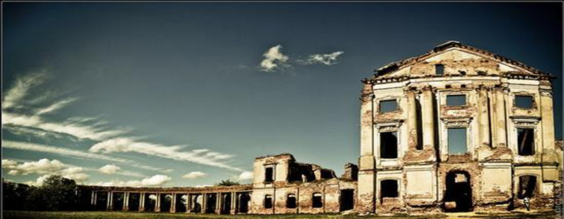
Дворец Сапегов в Ружанах