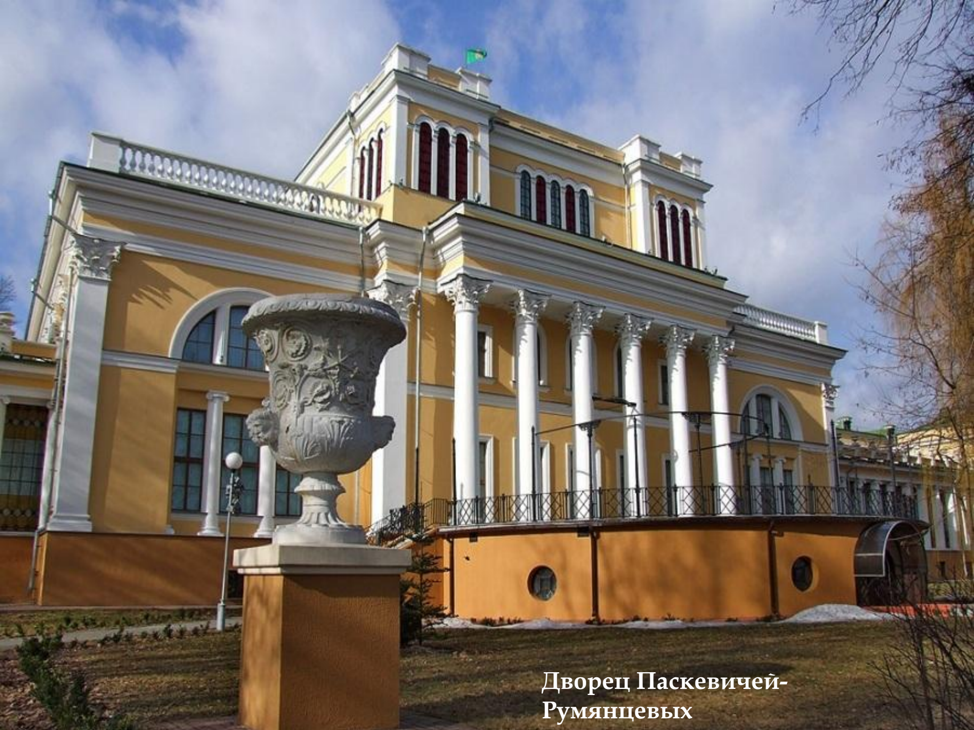
Дворец Паскевичей- Румянцевых