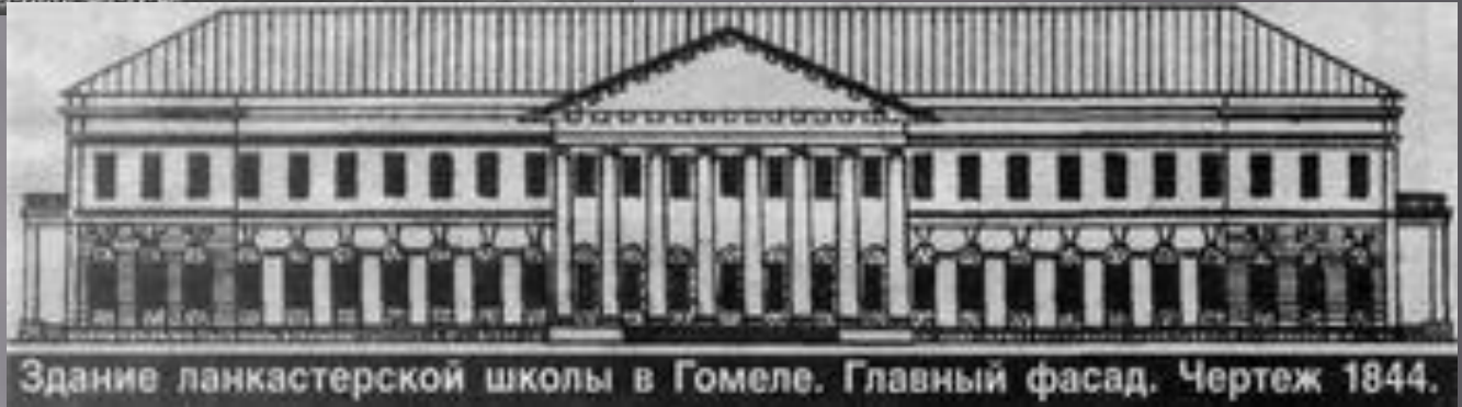
Здание ланкастерской школы в Гомеле. Главный фасад. Чертеж 1844.