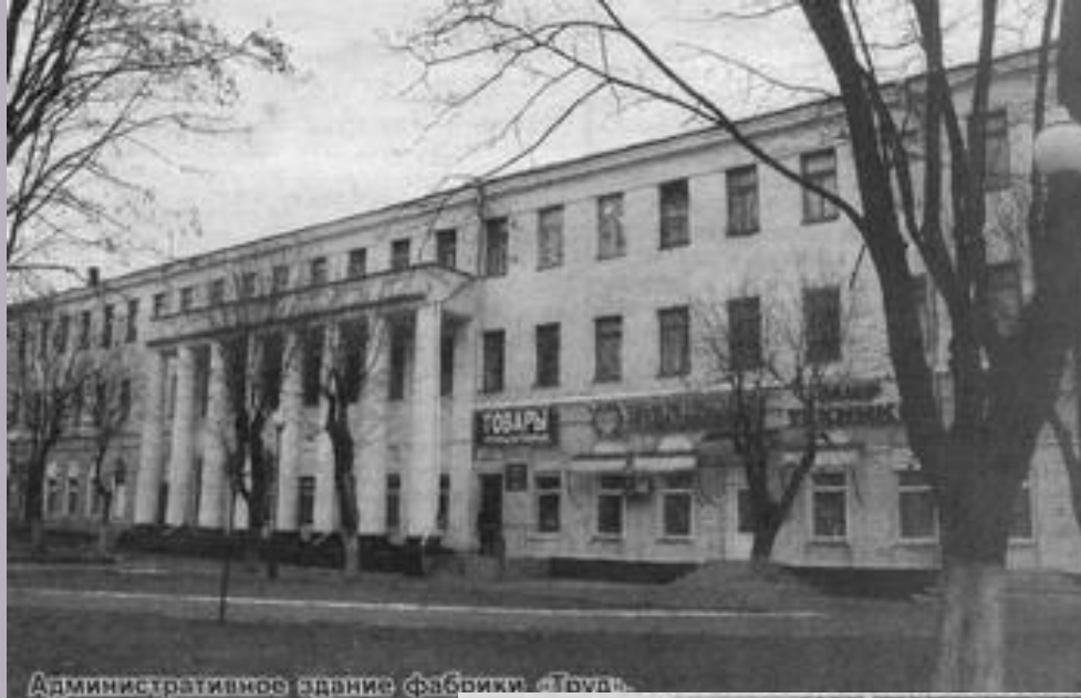
Административное здание фабрики Товара