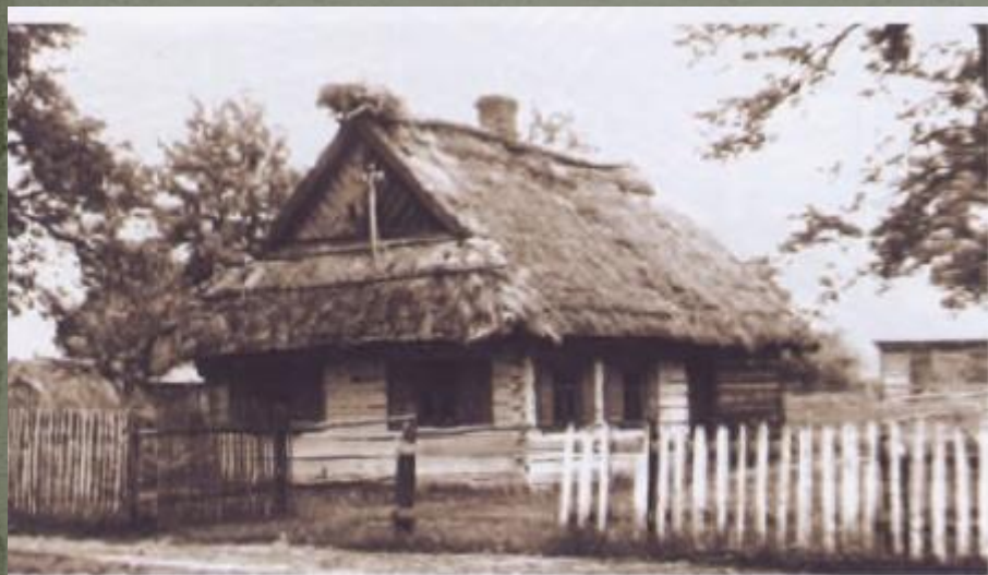
4 — Жилой дом в Черске Брестского района

С XIX в. это основной тип жилья. Варианты план-ых решений различно, но наиболее распространена схема: хата+ сени+ хоз. постройка. Для отопления хаты сооружали отдельную печь с выходом дыма через общий дымоход с кухонной печью.