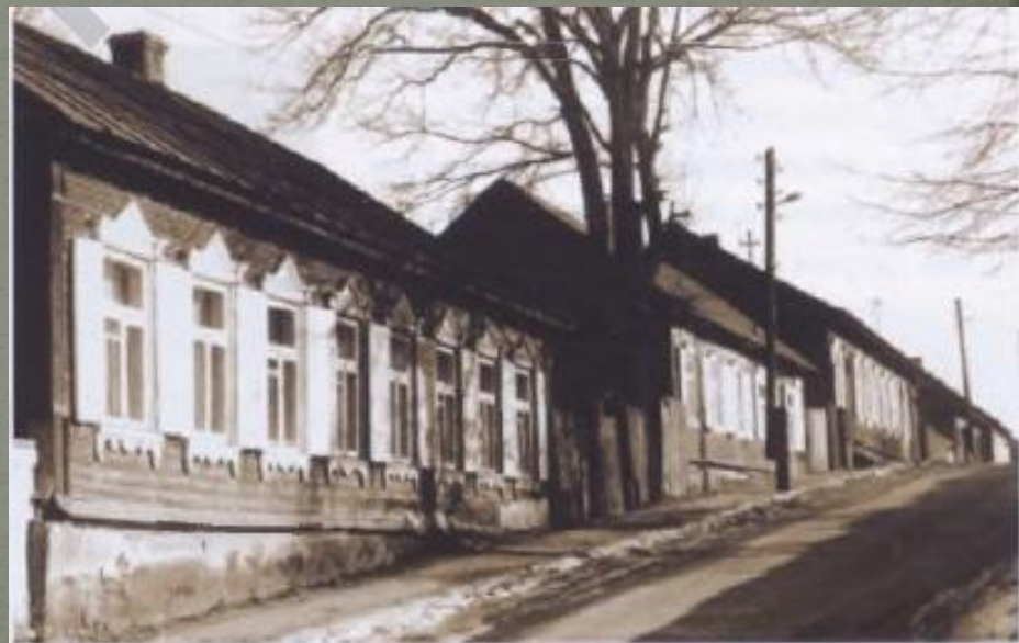
12 — Жилые дома на Северном переулке в Минске