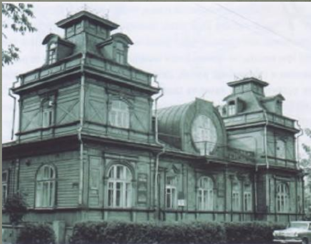
26 — Особняк в Бобруйске

Особая ценность городской земли требовала более высокой плотности застройки. Отсюда — вертикальное развитие Объемно планировочной структуры жилья (мансарды, мезонины, ломанные и мансардные крыши), чего не было в деревнях.