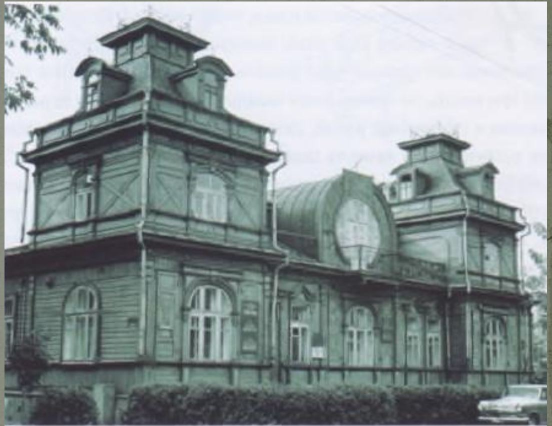
26 — Особняк в Бобруйске

Особая ценность городской земли требовала более высокой плотности застройки. Отсюда — вертикальное развитие Объемно планировочной структуры жилья (мансарды, мезонины, ломанные и мансардные крыши), чего не было в деревнях.