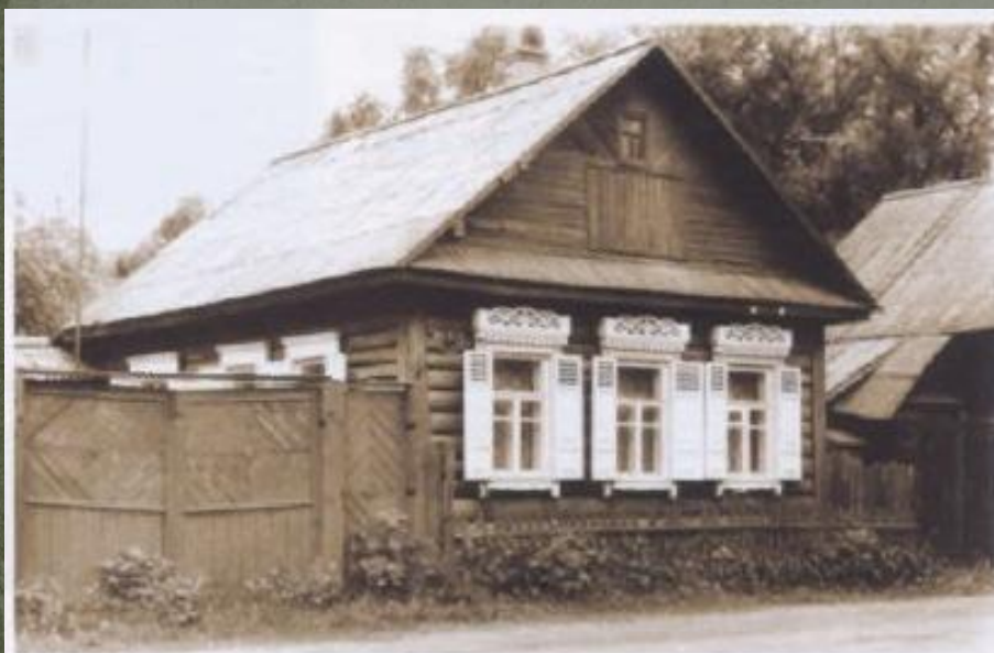
13 — Жилой дом в Рогачеве

Городское жильё от сельского повсеместно отличалось более четким построением фасадов, особенно главного, выходящего на улицу. Городские дома, как правило, повыше, в них раньше стали досками подшивать карнизы и обшивать стены, а окна обычно имели ставни. Использовался резной архитектурный декор.