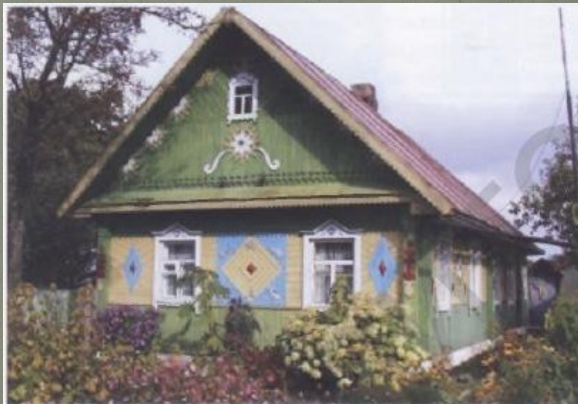
32 — Жилой дом в Клинке Червенского района

В архитектуре любого народа именно жилище в наибольшей мере выражает представление о том, как на данной территории с учётом местных природно-климатических условий должна быть организована среда обитания человека, каким формам отдаётся предпочтение.