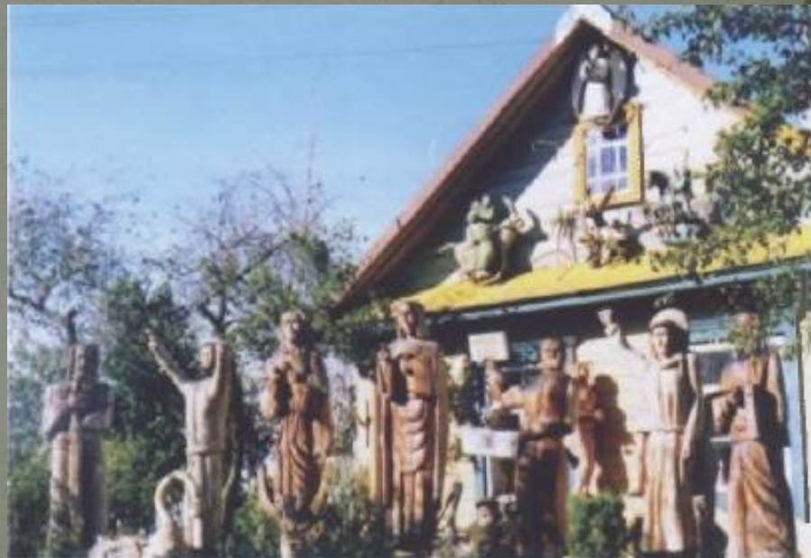
35 — Деревянная скульптура перед домом народного мастера Петра Зеляевского в Слободке Браславского района.