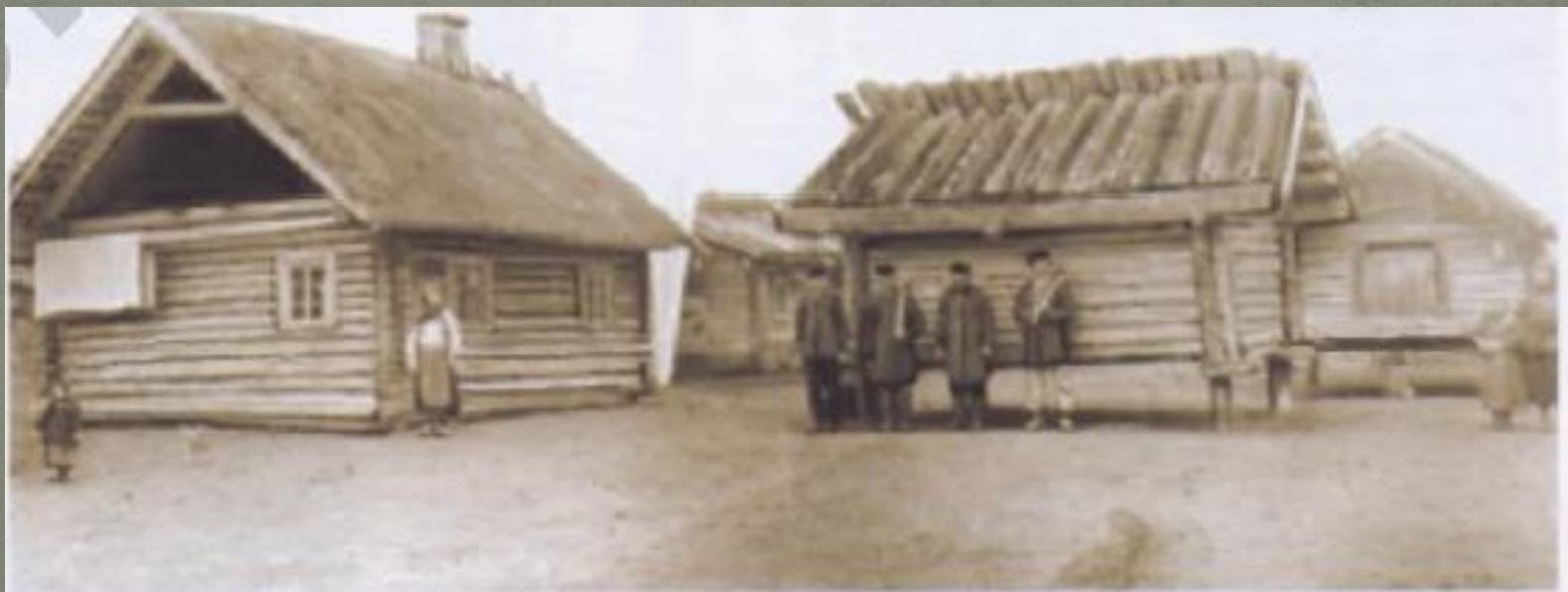
3 — Застройка деревни Большие Чучевичи Лунинецкого района (Фото начала XX в.)

Фактически это один сруб. В XVII в. Было широко распространено, то в конце XIX в. Оно было уже редкостью и в основном встречалось в Полесье. Впоследствии такое жильё встречалось как временное. Однако предусматривалось превращение его в более сложный тип дома.