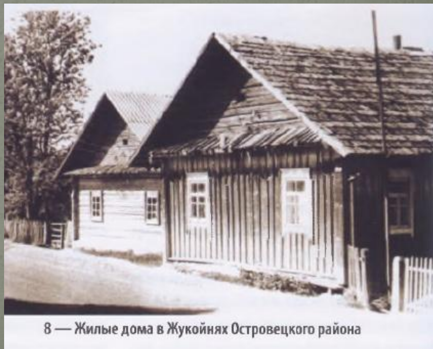
8 — Жилые дома в Жукойнях Островецкого района