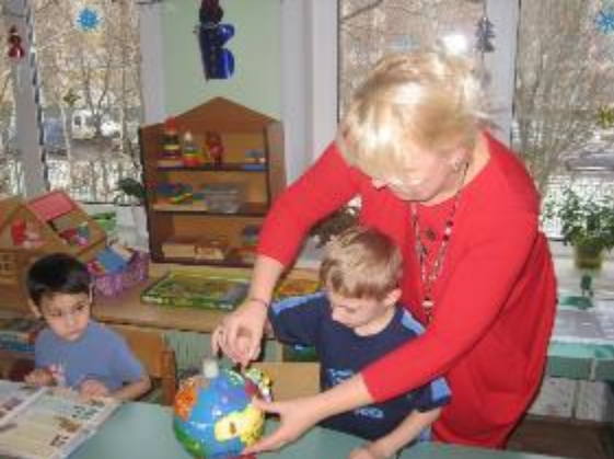
Знакомство с глобусом ...