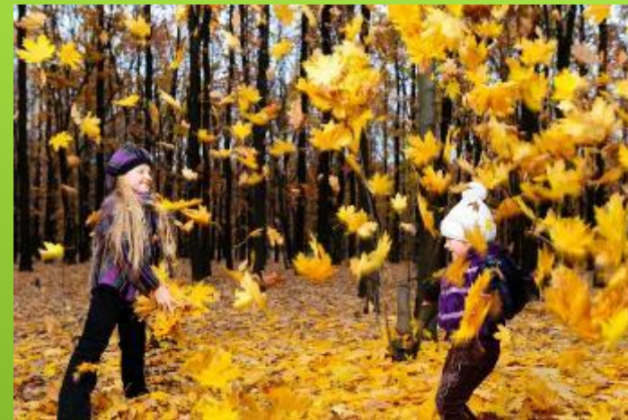
Дети в осеннем парке