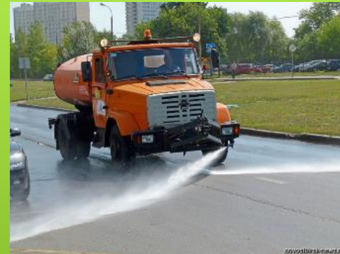
Труд людей в природе