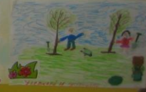
Итоговая работа: Эко. плакат «Бережём планету вместе»