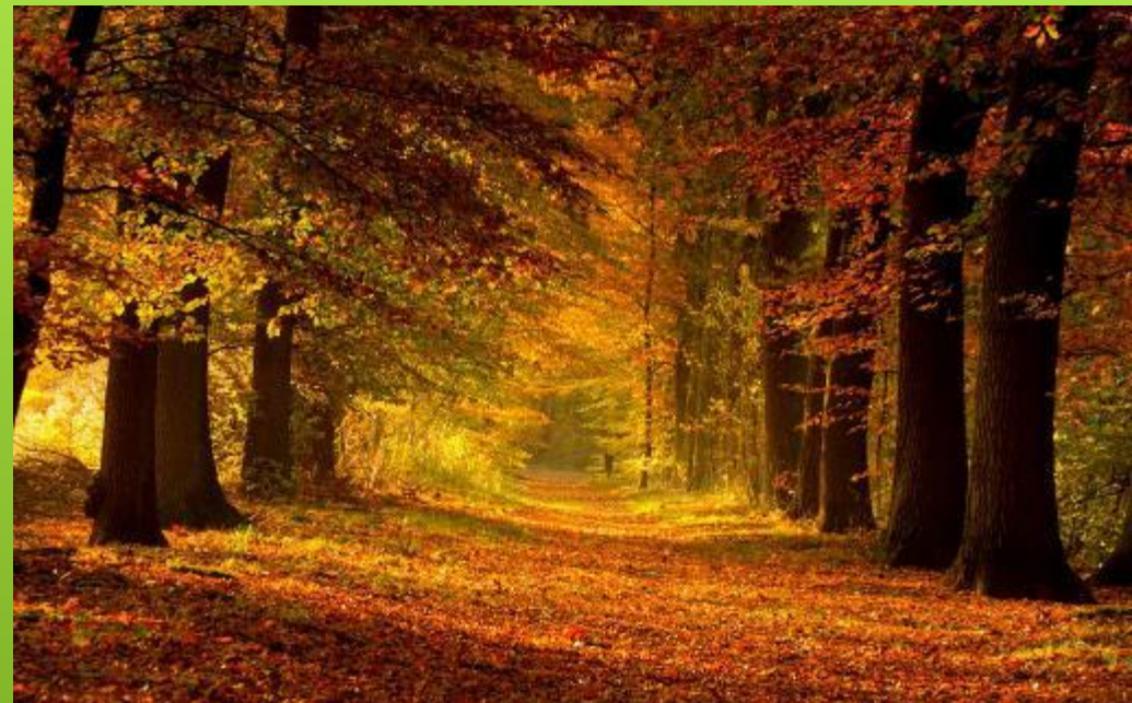
Красота Российского леса