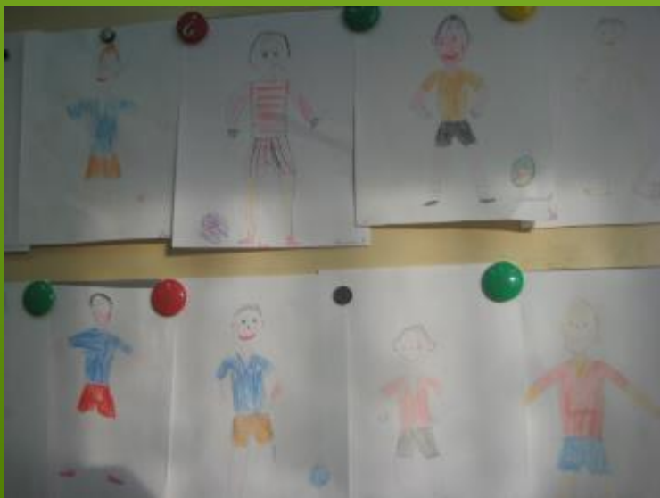
Рисование «Мы любим физкультуру»