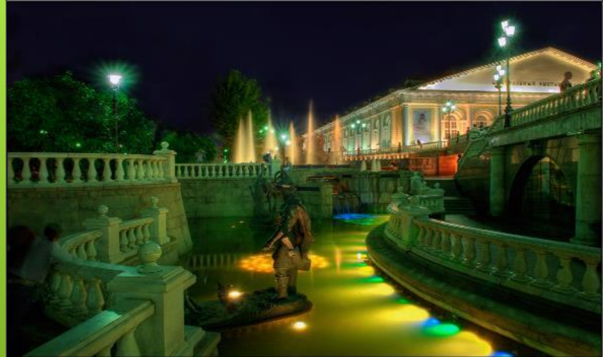
Зеленые парки Москвы