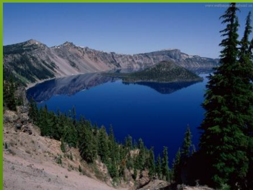
Водные ресурсы России