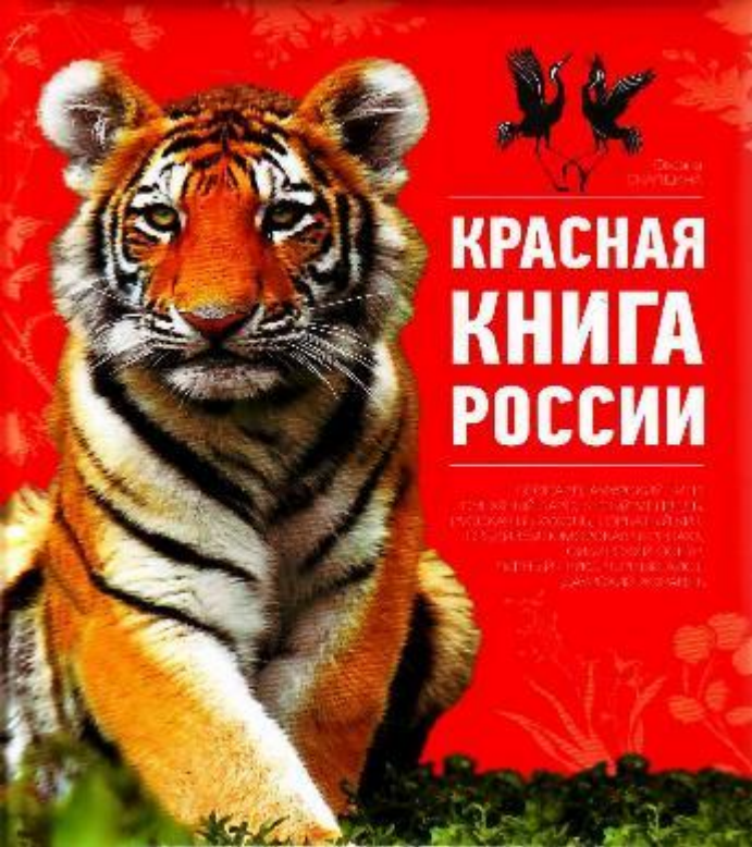
Знакомство с «Красной книгой»