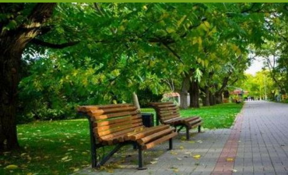
Писатели о природе...