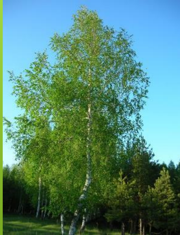
Русская береза в поэзии...