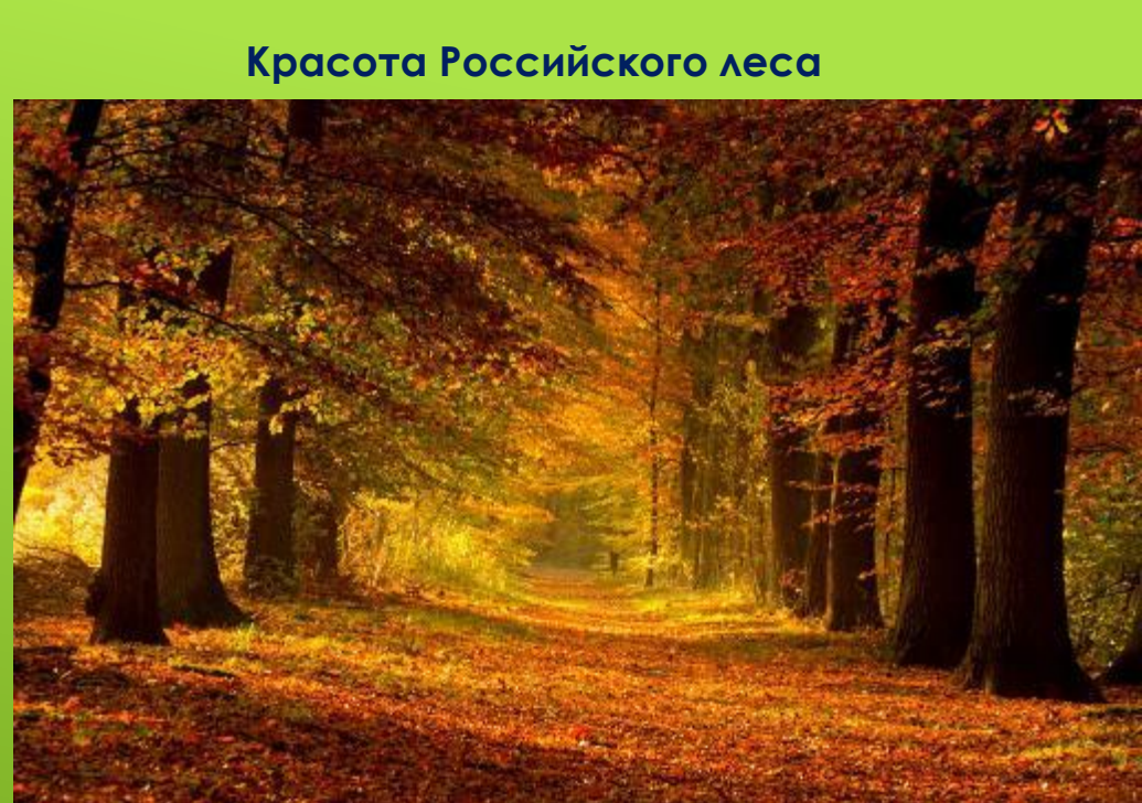
Красота Российского леса