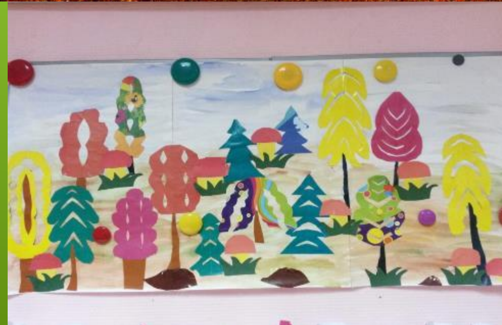
«Лес – словно терем расписной»