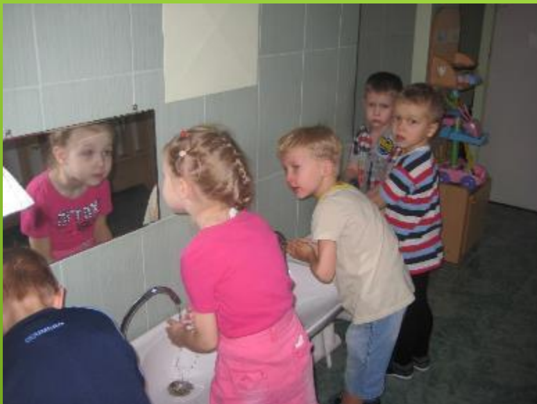
Научим малышей правильно умыться...