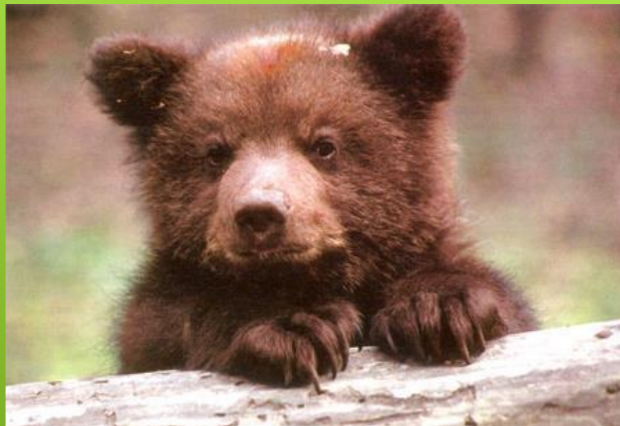
Животный мир России