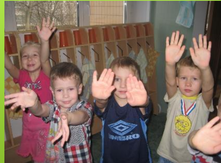
«Чистые ладошки» Физ. Досуг «Мы любим физкультуру»