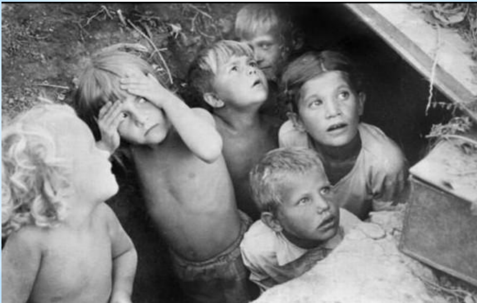
Дети прятались от налетов немецких самолетов