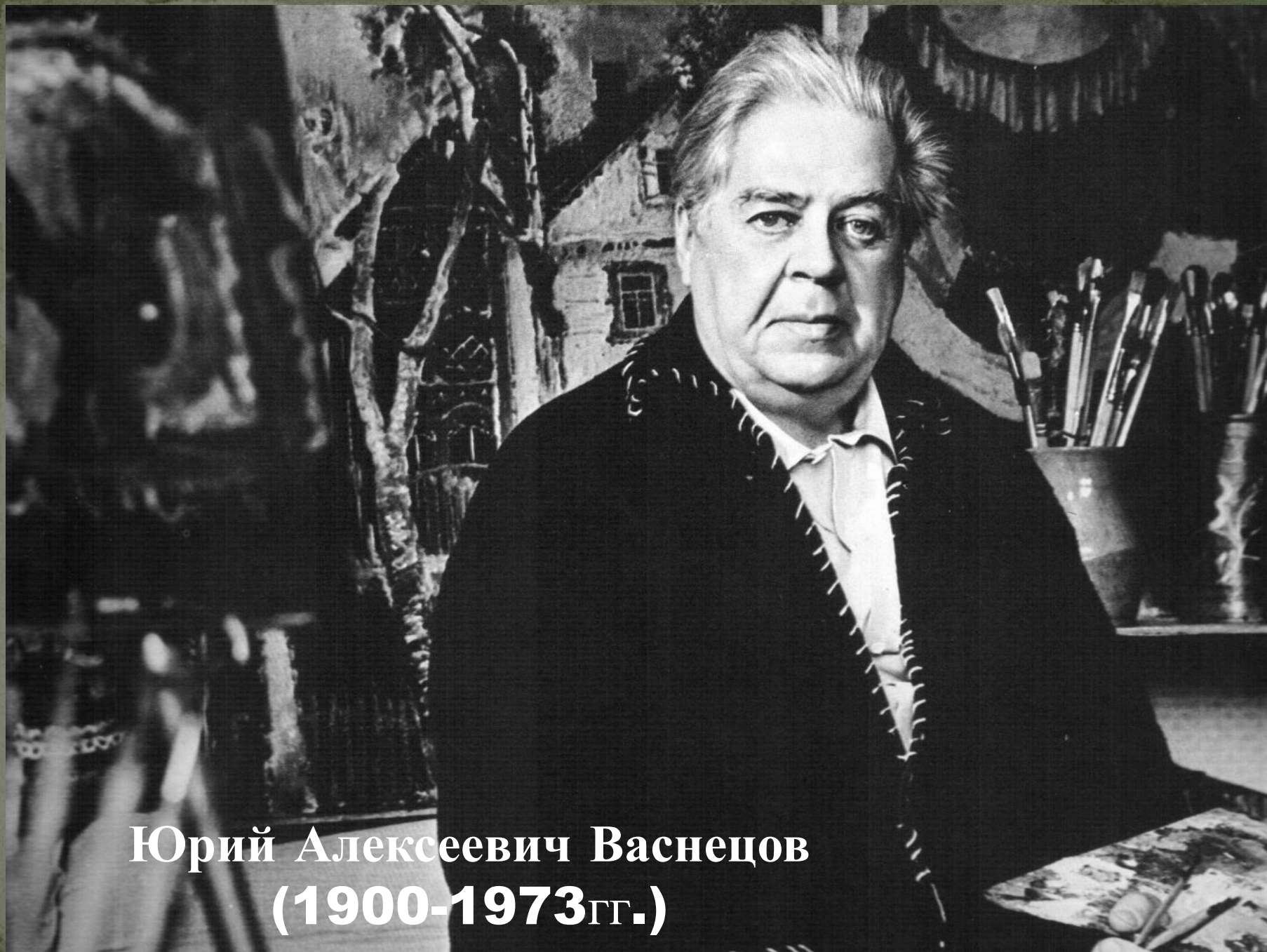
Юрий Алексеевич Васнецов (1900-1973гг.)