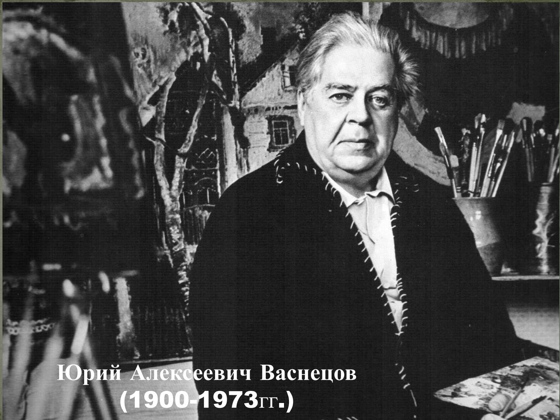
Юрий Алексеевич Васнецов (1900-1973гг.)