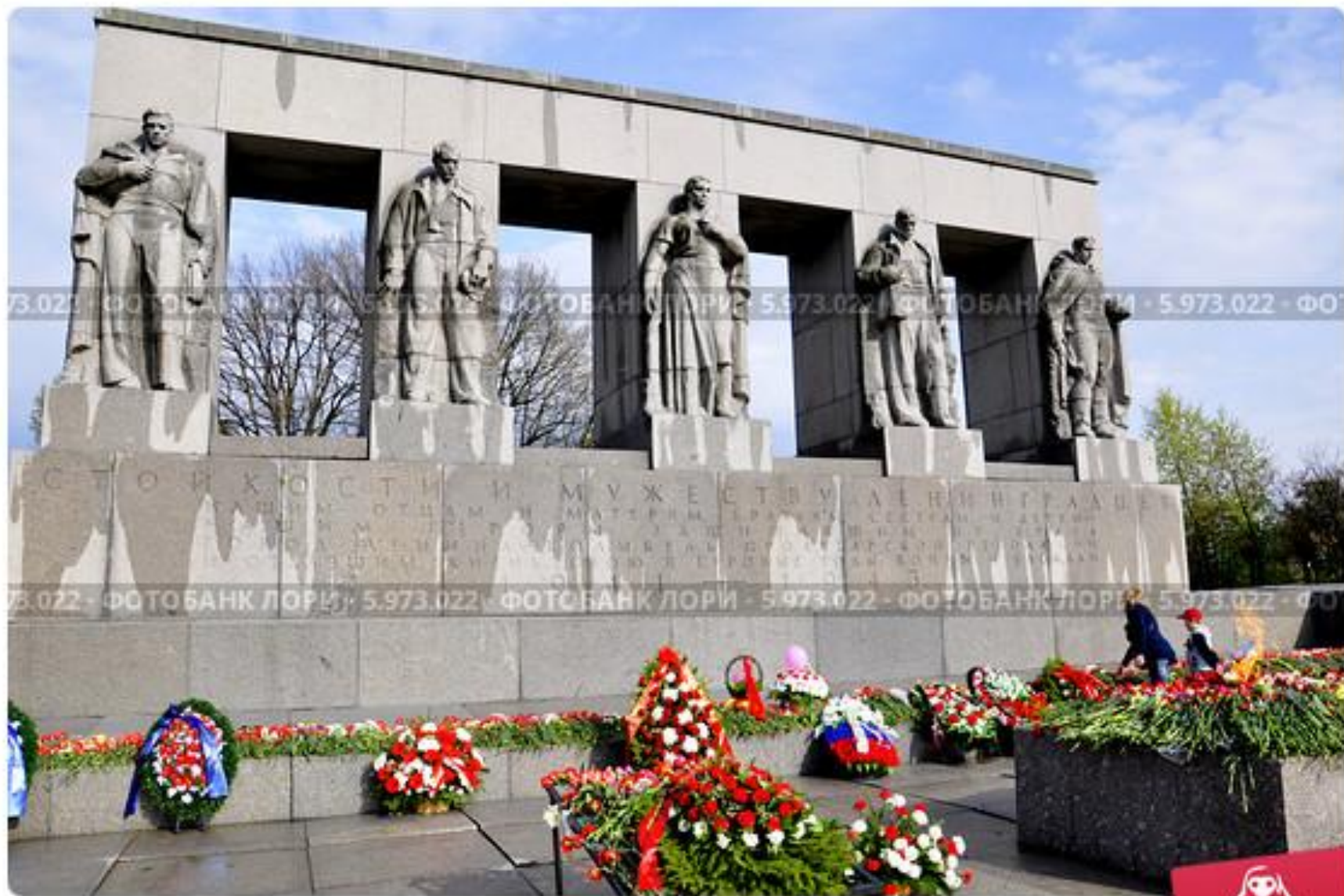
Мемориал памяти ленинградцев погибших в годы блокады Ленинграда