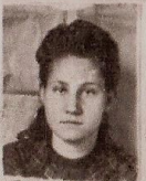
Сч. эска. Д.С. Дожанова