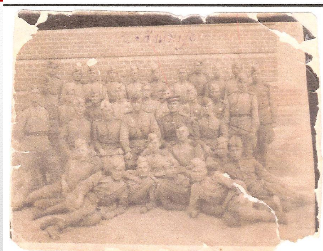
Фото на память о службе на 3-ем Белорусском фронте. Литовская АССР, 1/IX-44г.