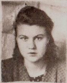
Сч. матер. гр. Л.А. Шен