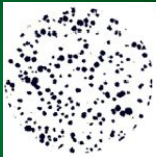
Высокопрочный чугун с шаровидным графитом