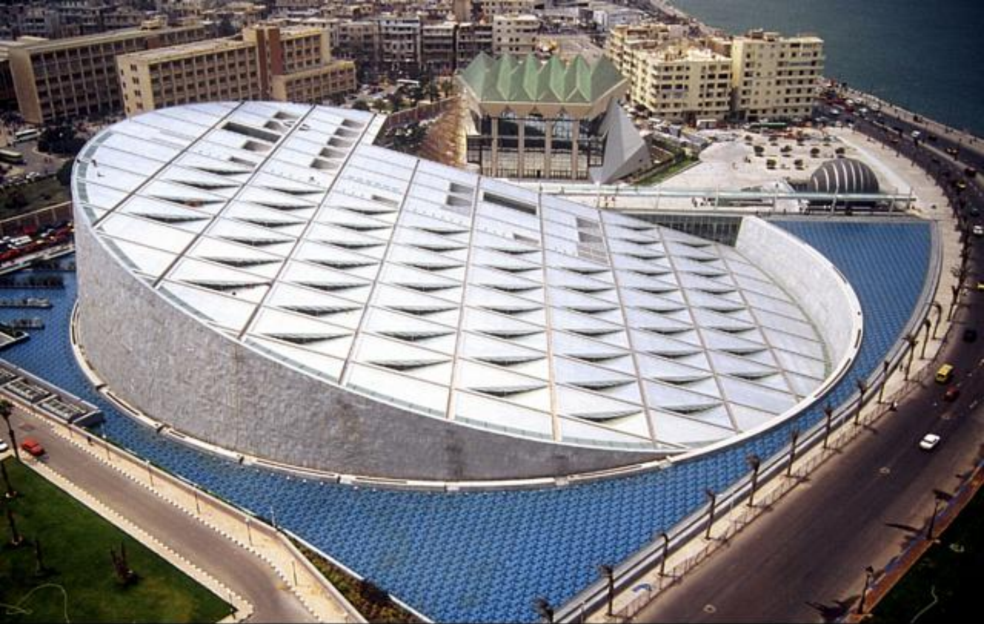
Александрйская библиотека, Александрия, Египет