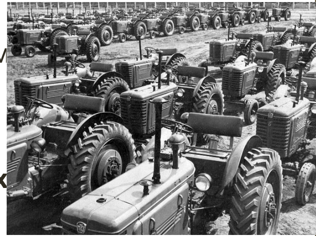
Построен Минский тракторный завод