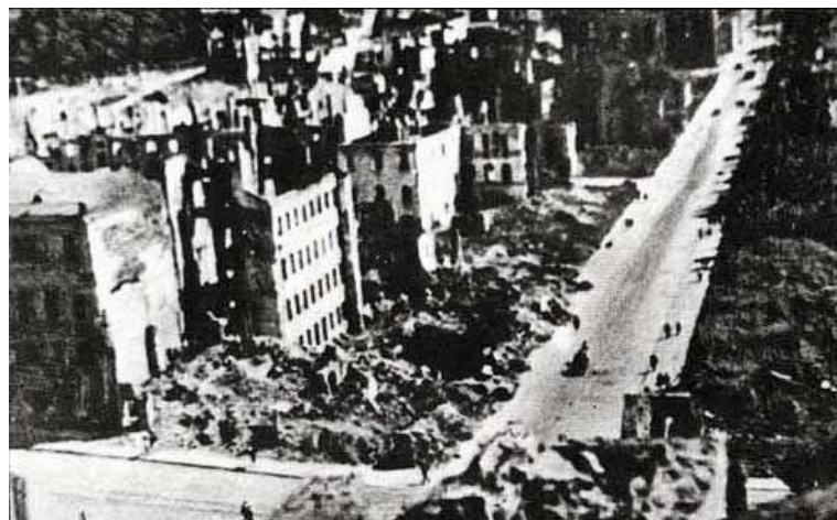
Минск после войны