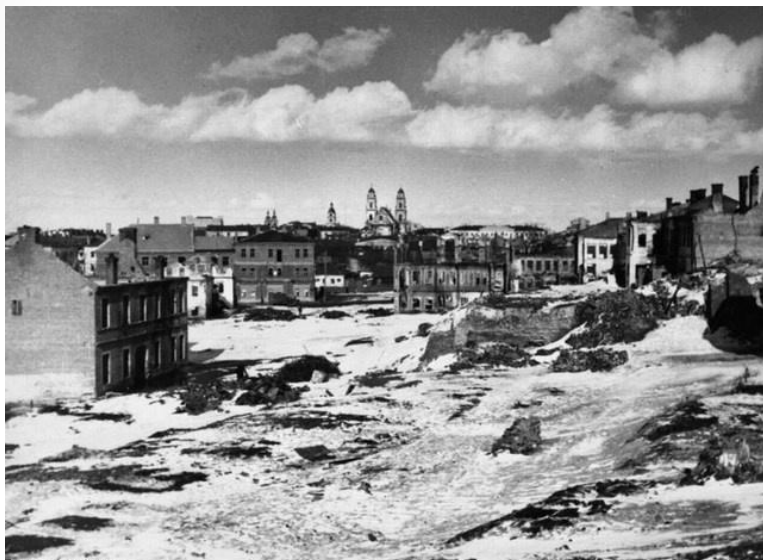
Bundesarchiv, Bild 141-2020 Foto: o. Ang. 1.1041/1943 ca.