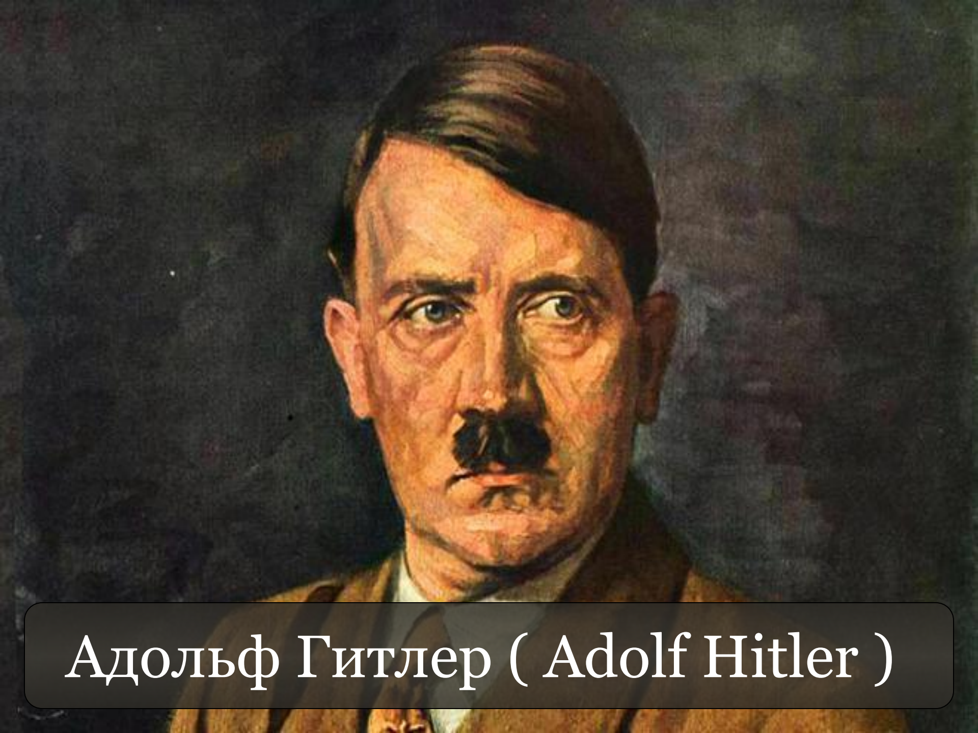
Адо́льф Гитле́р ( Adolf Hitler )