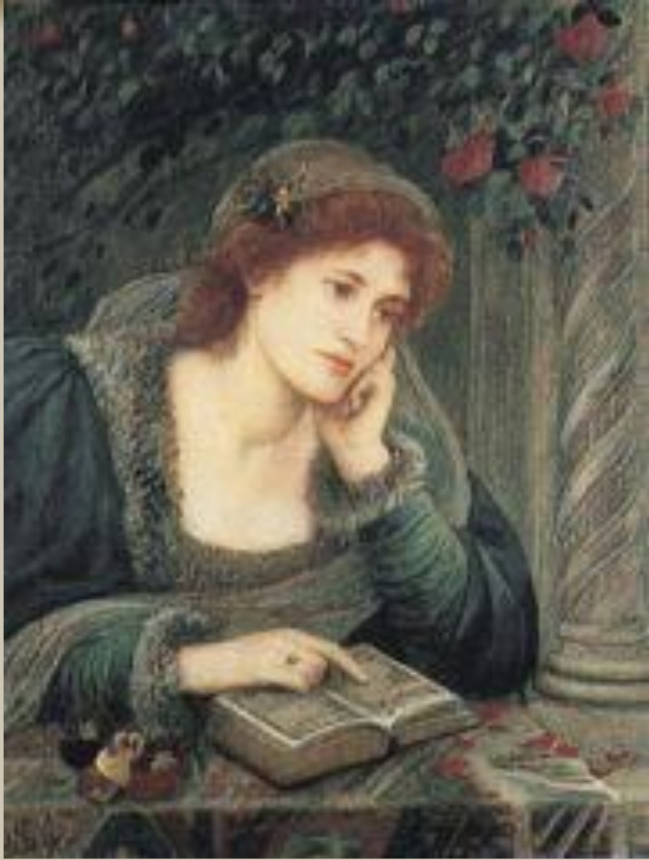
Беатриче Портинаре - единственная любовь Данте Алигьери