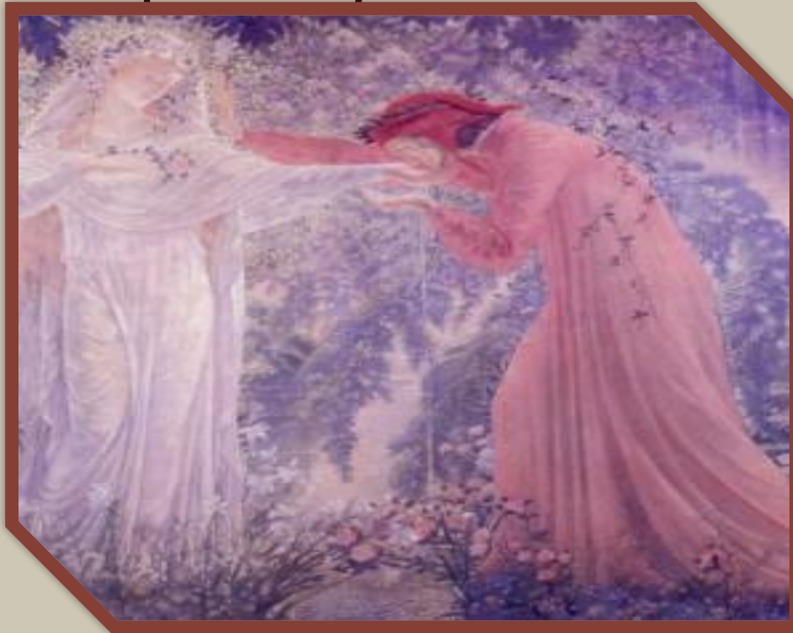
Джемма и Данте