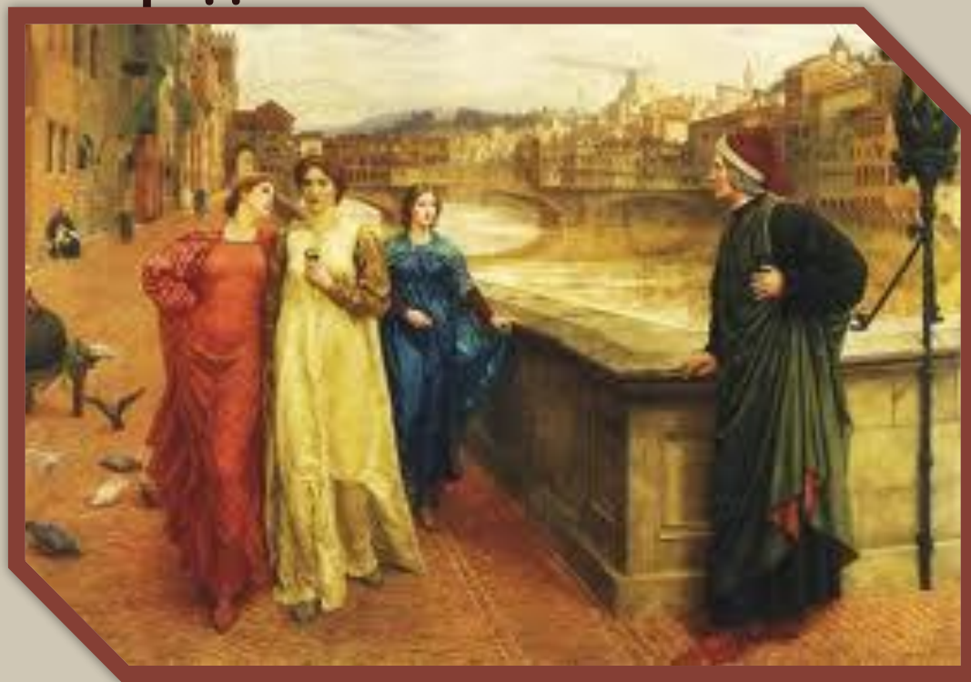
Беатриче и Данте