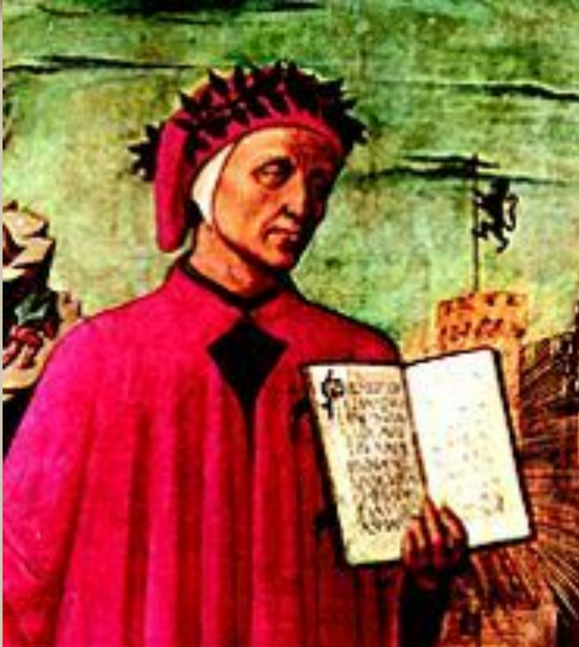
Данте Алигьери. Фреска Доменико ди Микелино в соборе Санта Мария дель фьоре во Флоренции. 15 в.