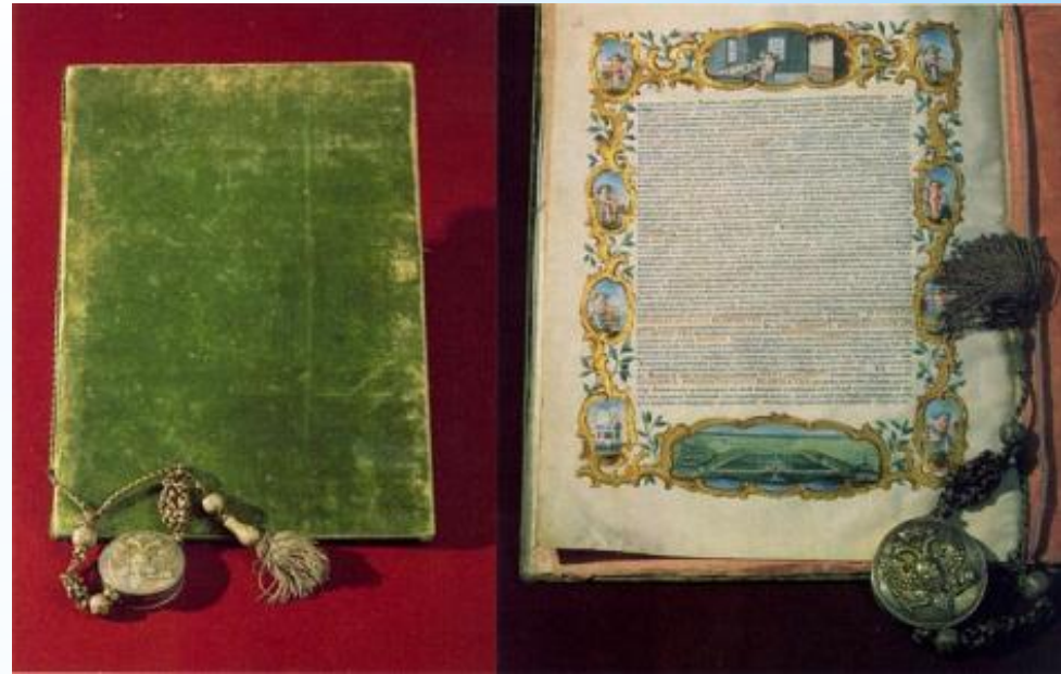
Жалованная грамота М. В. Ломоносову на владение землями в Ораниенбаумском уезде. 1756