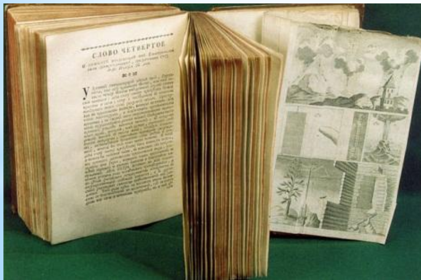
М. В. Ломоносов «Слово о явлениях воздушных...». 1753