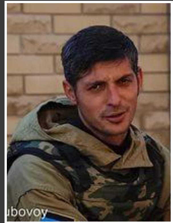
Он воевал за Донецк, а он воюет за Моторолу и за Донецк