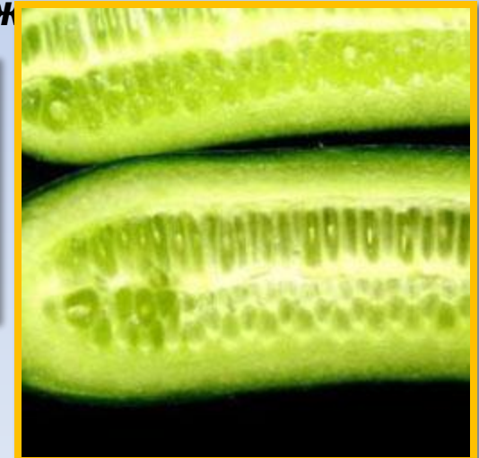
Плод огурца в разрезе.