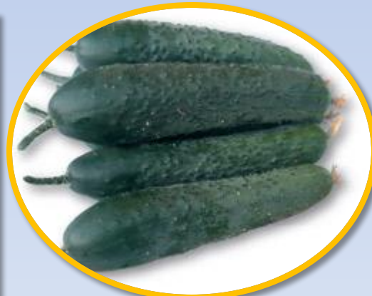
Мелкобугорчат ый белошипый