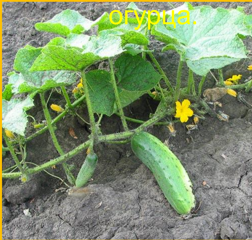
Внешнее строение растения огурца.