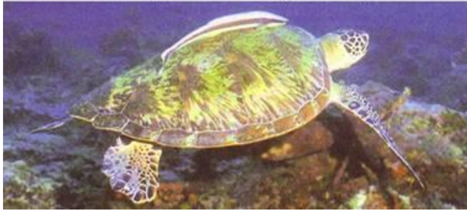
Рыба-прилипала на морской черепахе