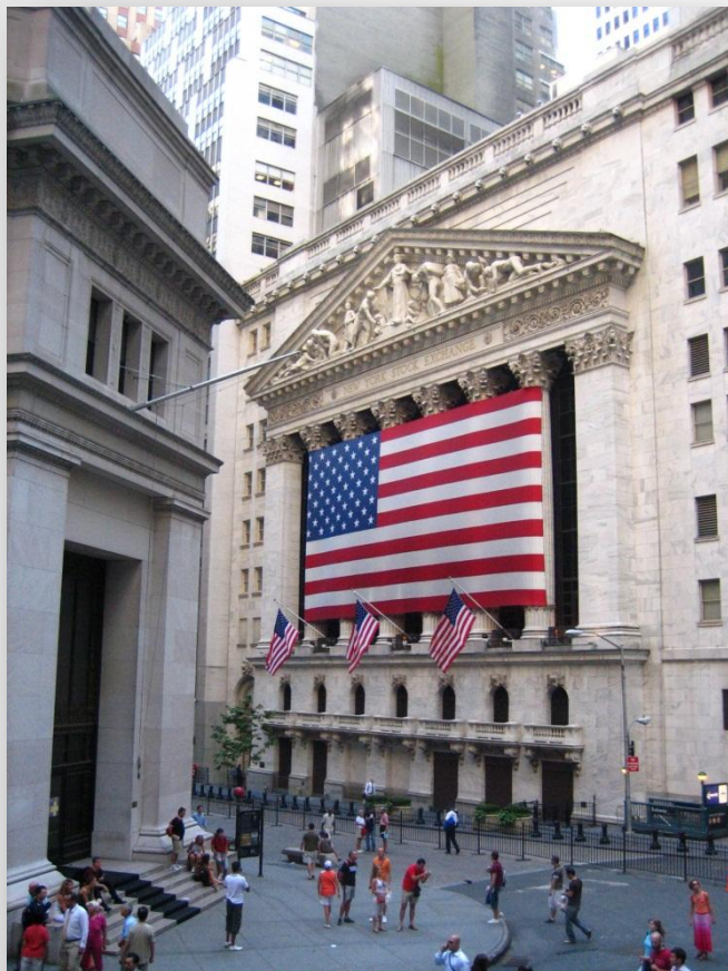
Нью-Йоркская фондовая биржа New York Stock Exchange (NYSE)