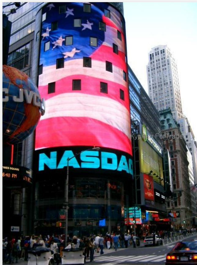
Электронная фондовая биржа США National Association of Securities Dealers Automated Quotations (NASDAQ)