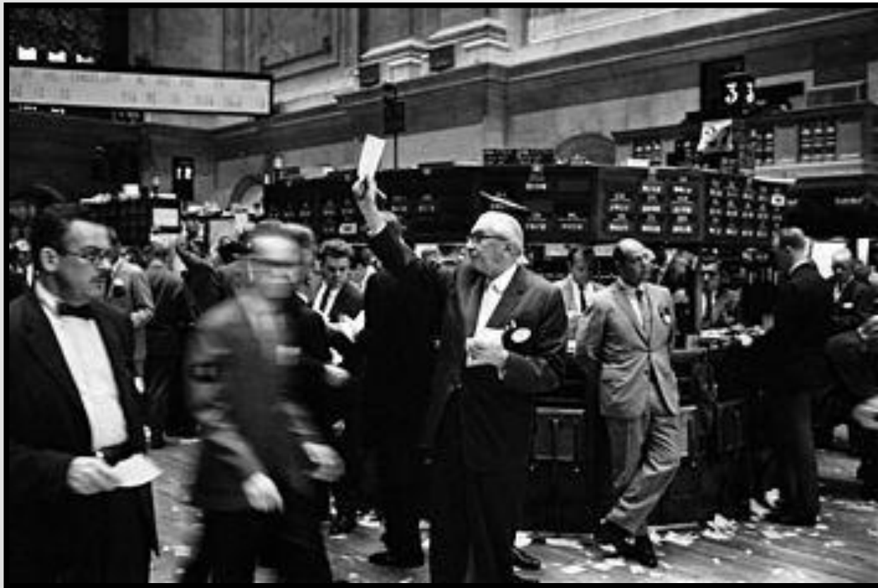
Нью-Йоркская фондовая биржа, 1963 год

Биржа – это объединение продавцов, покупателей и посредников с целью создания условий для торговли, увеличения, удешевления торговой операции; она является организатором торгов. Биржа позволяет сконцентрировать спрос и предложение на товар в одном месте и в одно время и тем самым быстро и наиболее верно оценить его цену . Биржа помогает получить информацию о конъюнктуре товарного рынка в данный момент в данной местности.