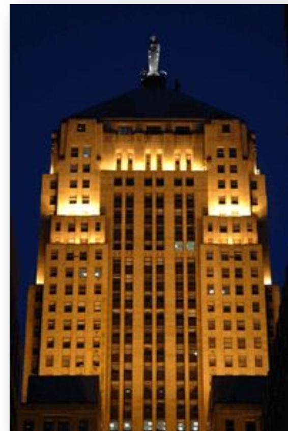
Фьючерсная и опционная биржа Chicago Board of Trade (CBOT)