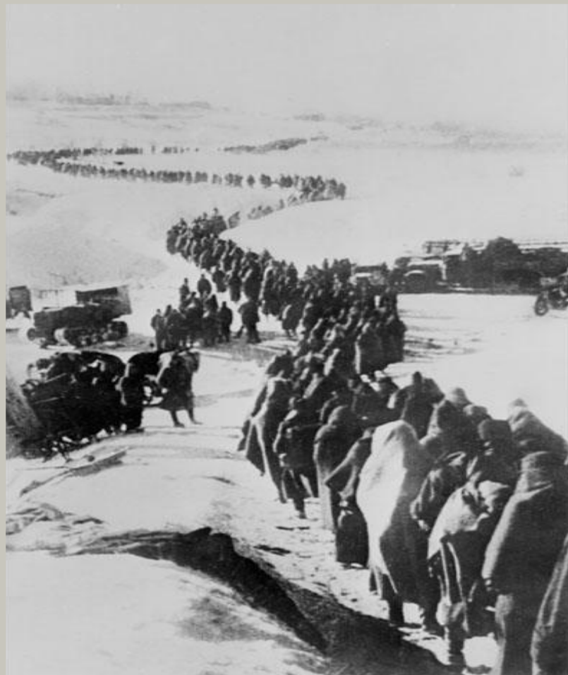
Армия Паульса в плену.