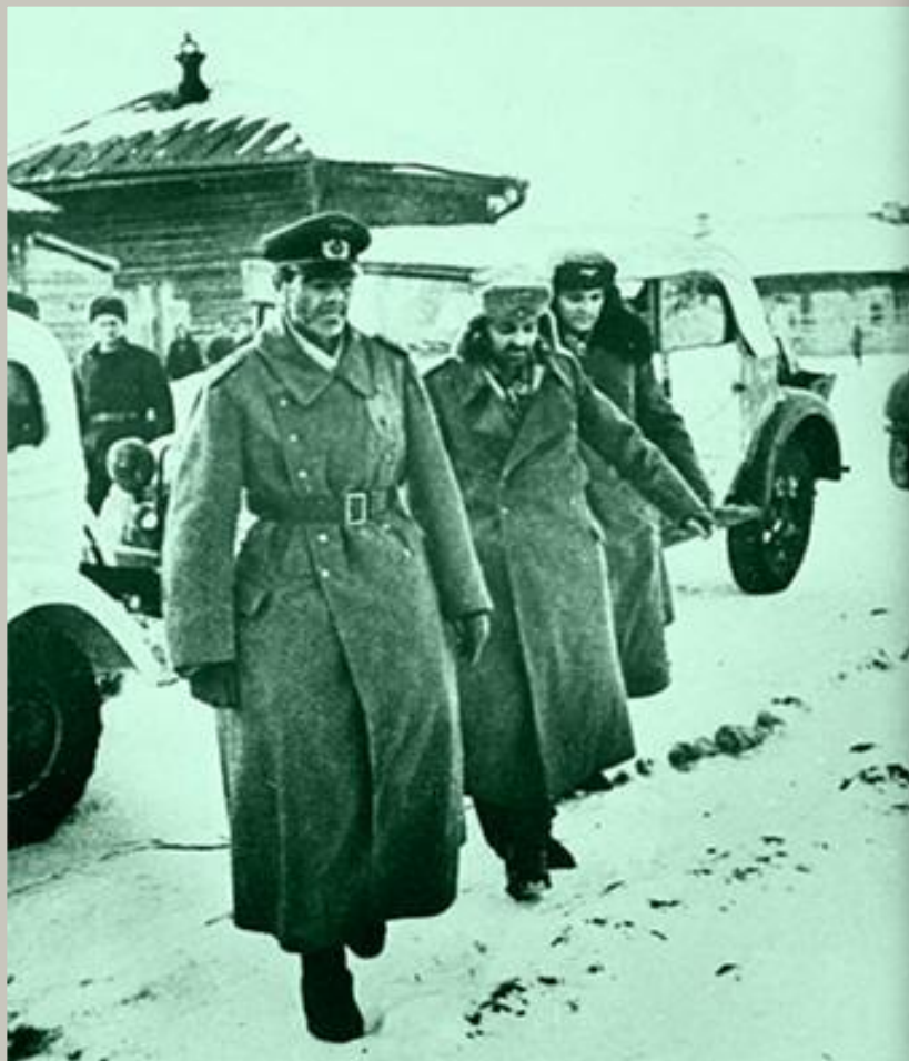
Генерал Паульс в плену.