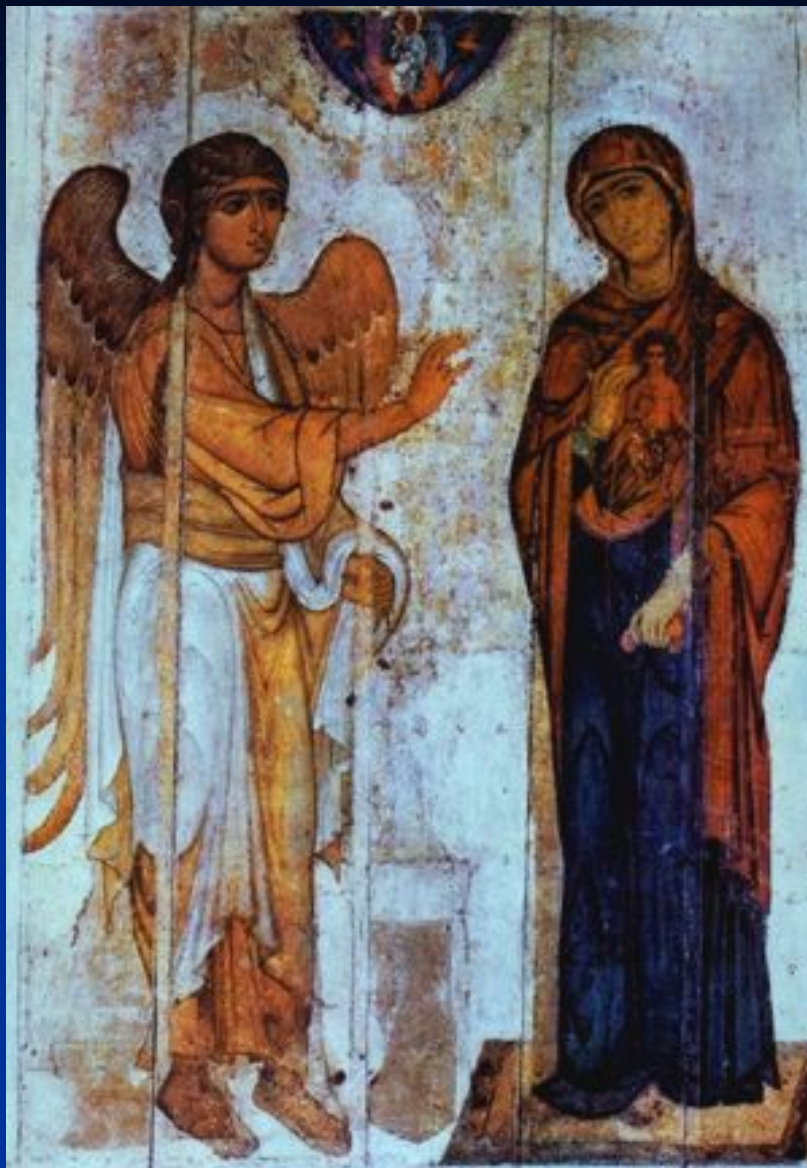
Устюжское Благовещение. Великий Новгород .XII век (ГТГ)