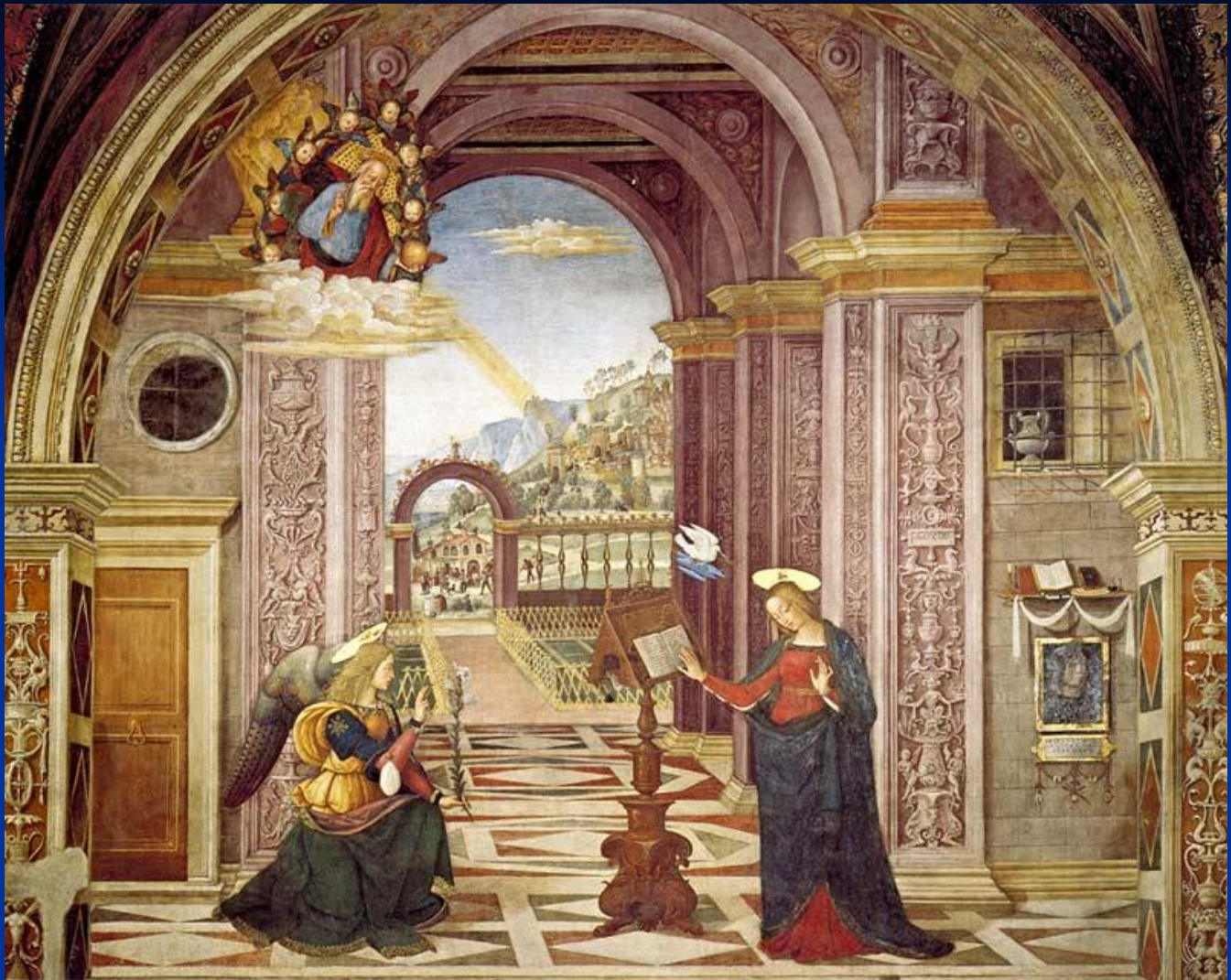
Пинтуриккьо. 1551. Благовещение. Перуджа, церковь Санта-Мария Маджоре