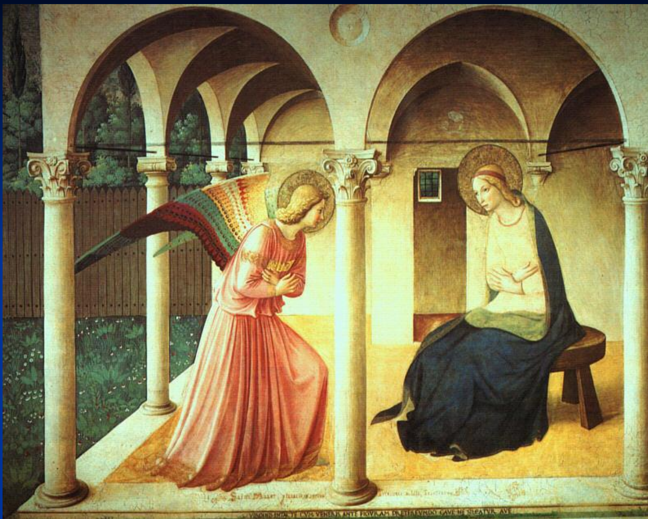
Фра Анджелико. 1450. Музей Сан-Марко. Флоренция