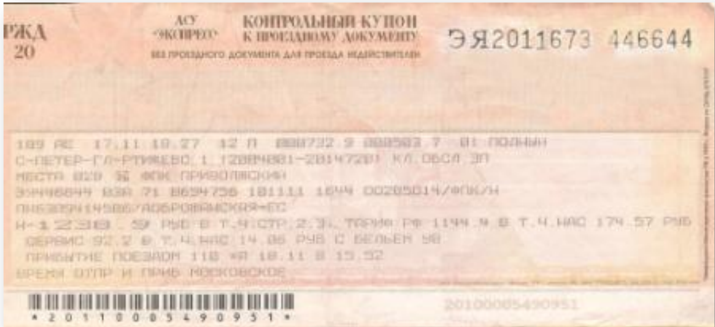
2 слип «Контрольный купон»