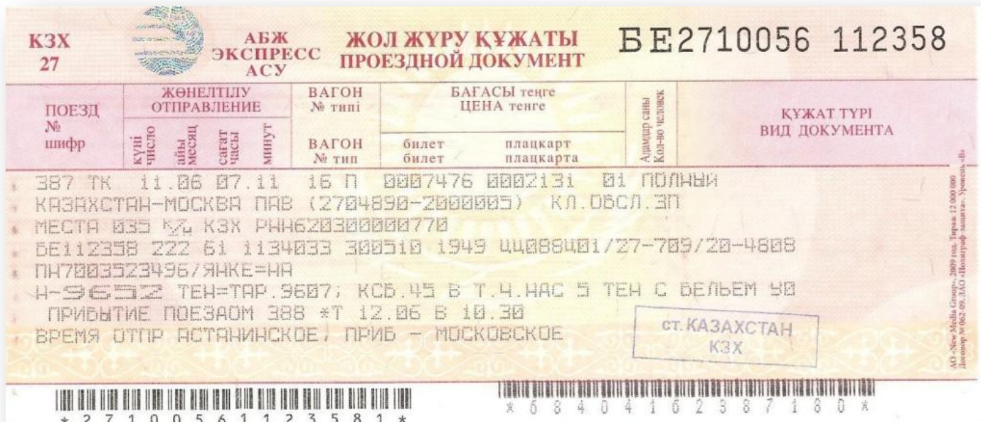
Проездной документ Казахстана