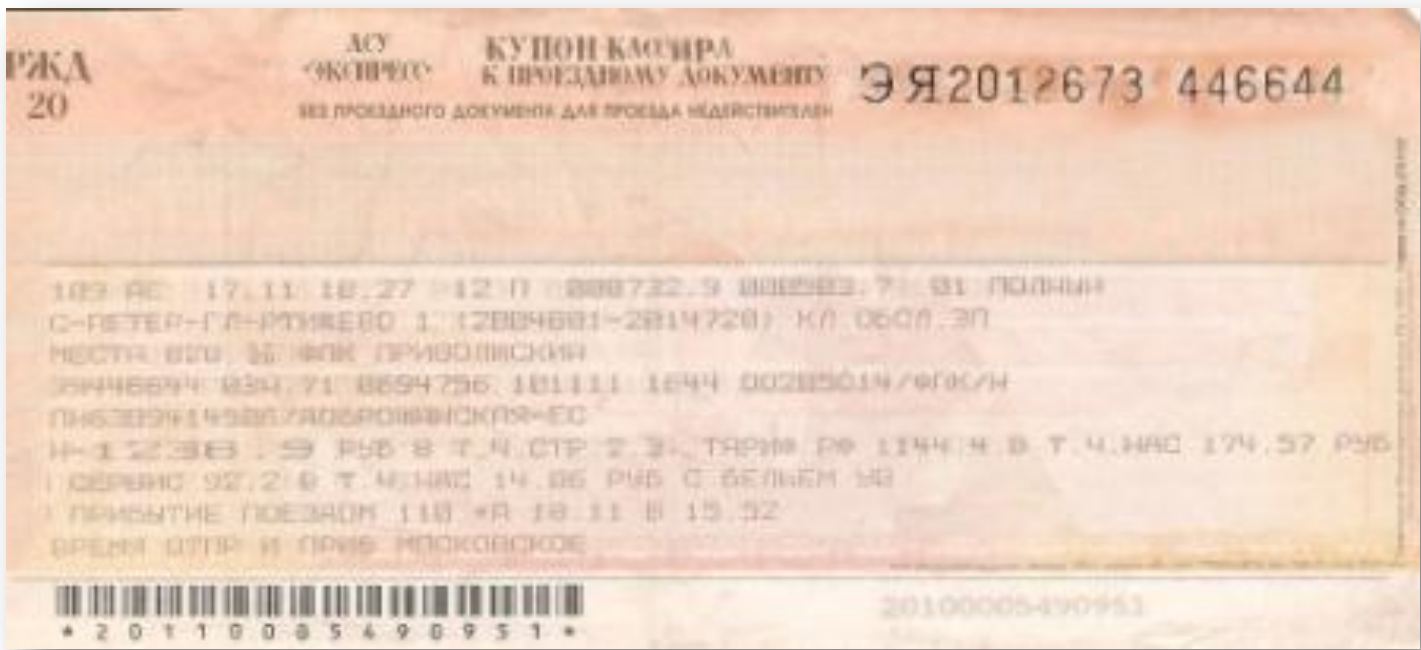
3 слип «Купон кассира»