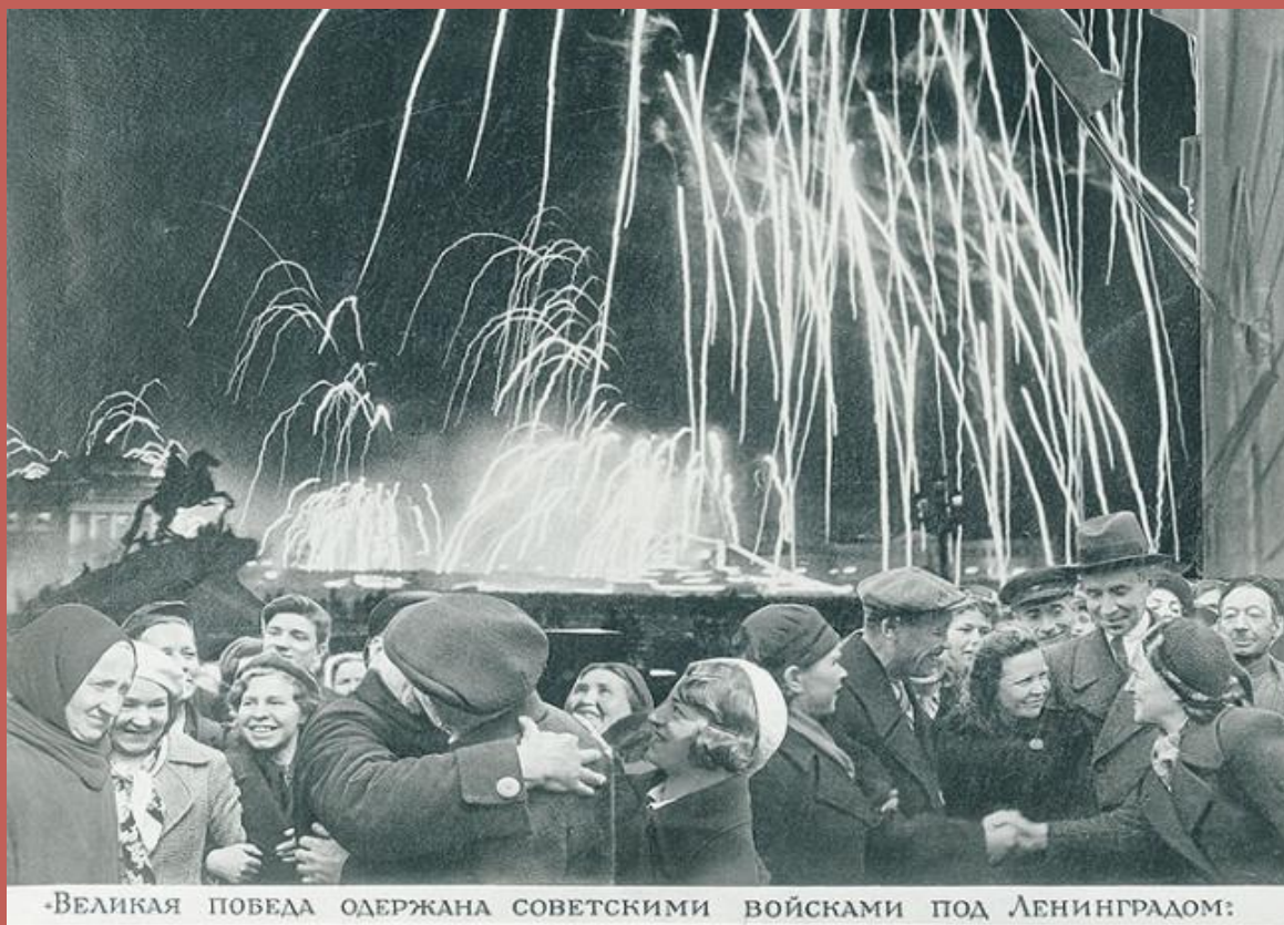
-Великая победа одержана советскими войсками под Ленинградом:

Формировать у детей представление о будничных и праздничных днях