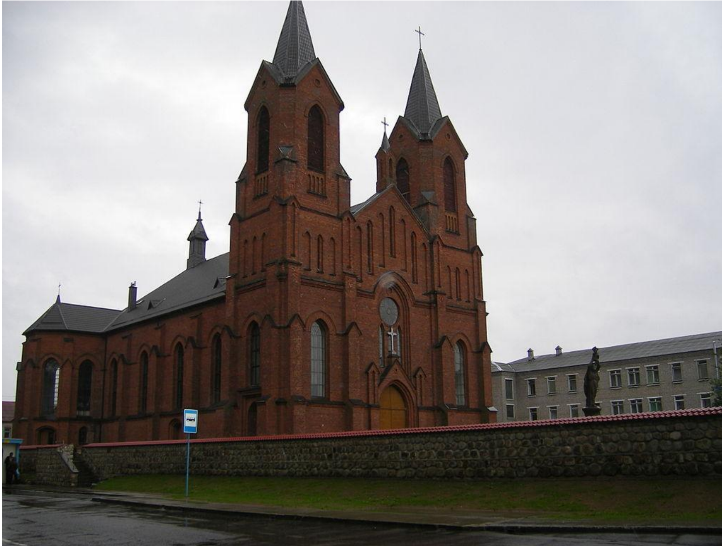
Костел Вознесіння Діви Марії, 1907 р.

У XIX-XX ст. на території Білорусі у неоготичному та неороманському стилі будувалися та перебудовувалися костели, а іноді й інші споруди.