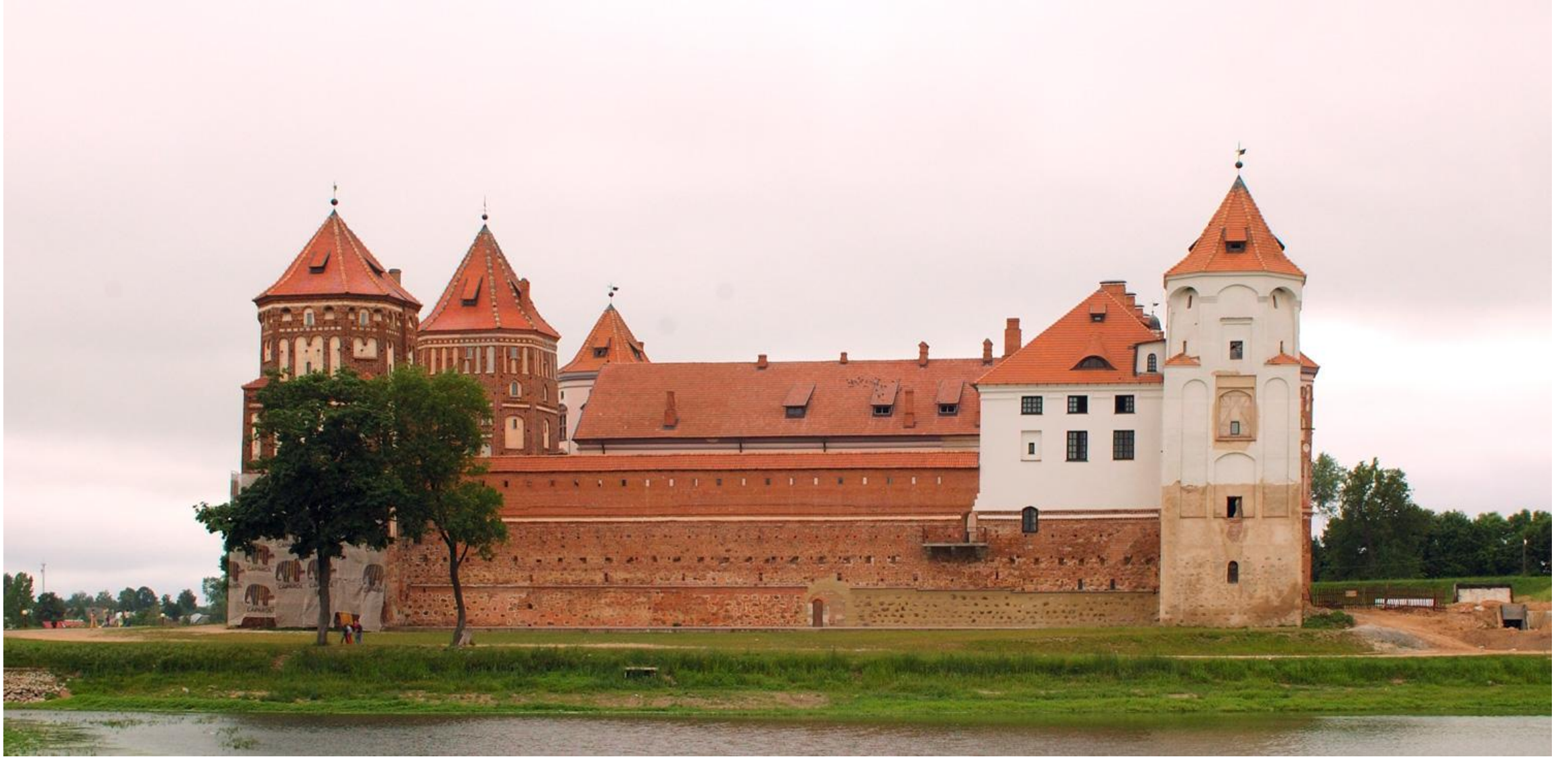
Мірський замок після реставрації