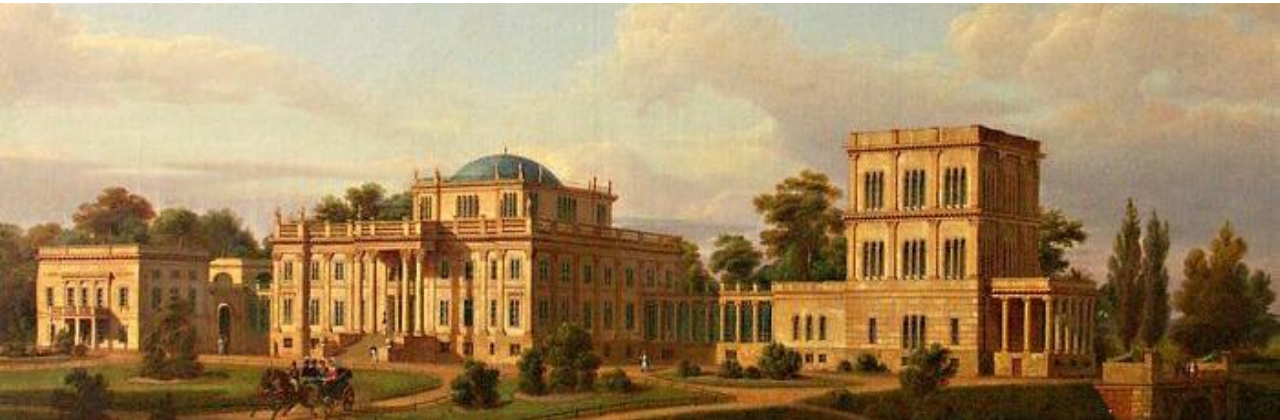
Садиба Рум'янцевих-Паскевичів у місті Гомель. 19 ст.