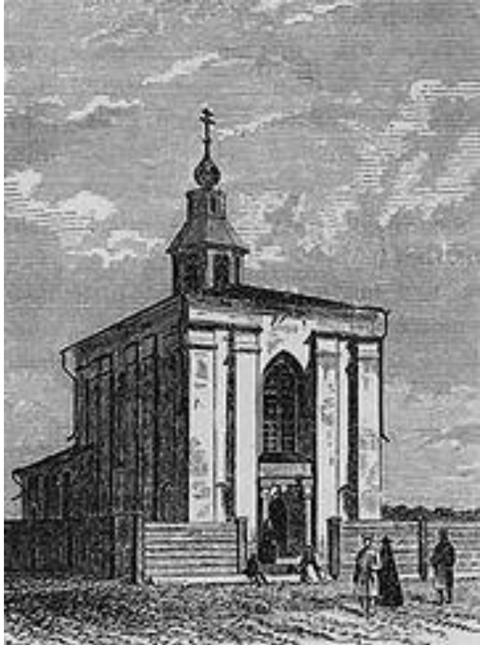
Борисоглібська церква в місті Гродно, 12