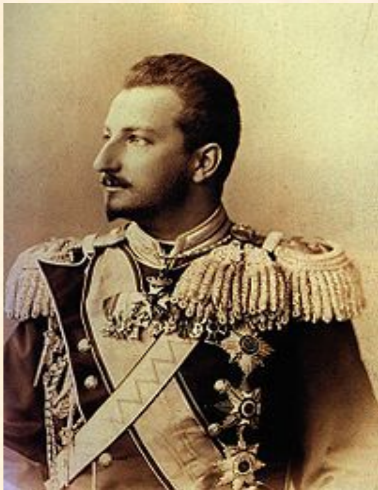
Цар Фердинанд I