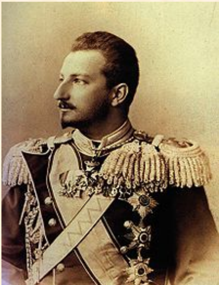
Цар Фердинанд I

Цар Фердинанд I у червні 1918р. Сформував уряд із прихильників Антанти на чолі з О. Малиновим.