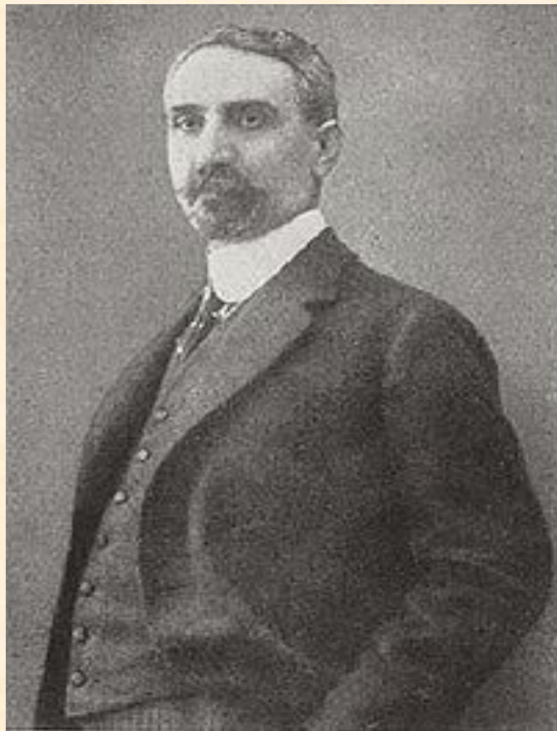
О. Малинов б