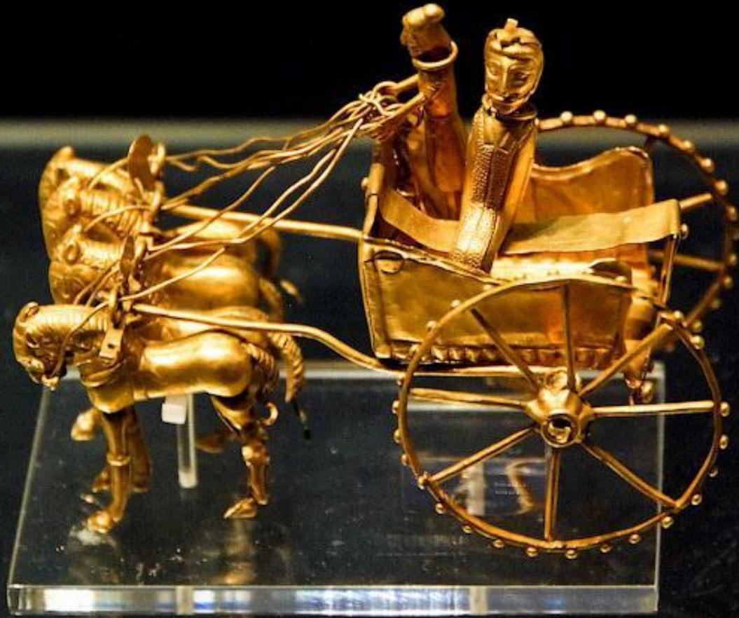
Золотая повозка из персидского государства Ахеименидов (500-300 до н.э.), найденная на территории современного Таджикистана.