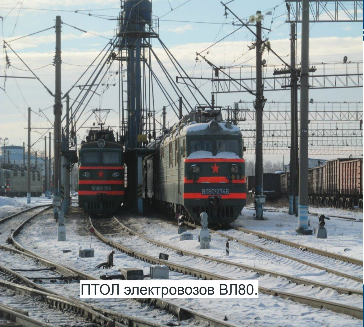
ПТОЛ электровозов ВЛ80.

Брянск II самая большая станция на Брянском узле, следующей по ходу Москва - Киев, сопоставимой по размерам является станция Дарница, находящаяся уже в столице Украины.