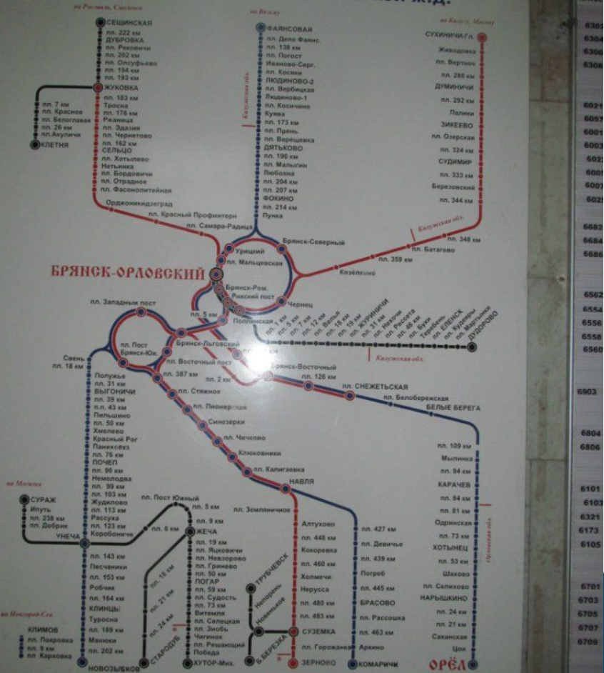
СХЕМА обращения пригородных поездов Брянского отделения Московской ж.д.

В 1992 году после развала Союза, Брянский узел стал для РФ приграничным и как бы висящем на самом кончике "переменики", уходящей в соседнюю Украину. А все брянские локомотивы получили плечо обслуживания, находящееся за пределами России, по линии Суземка - Конотоп - Дарница.