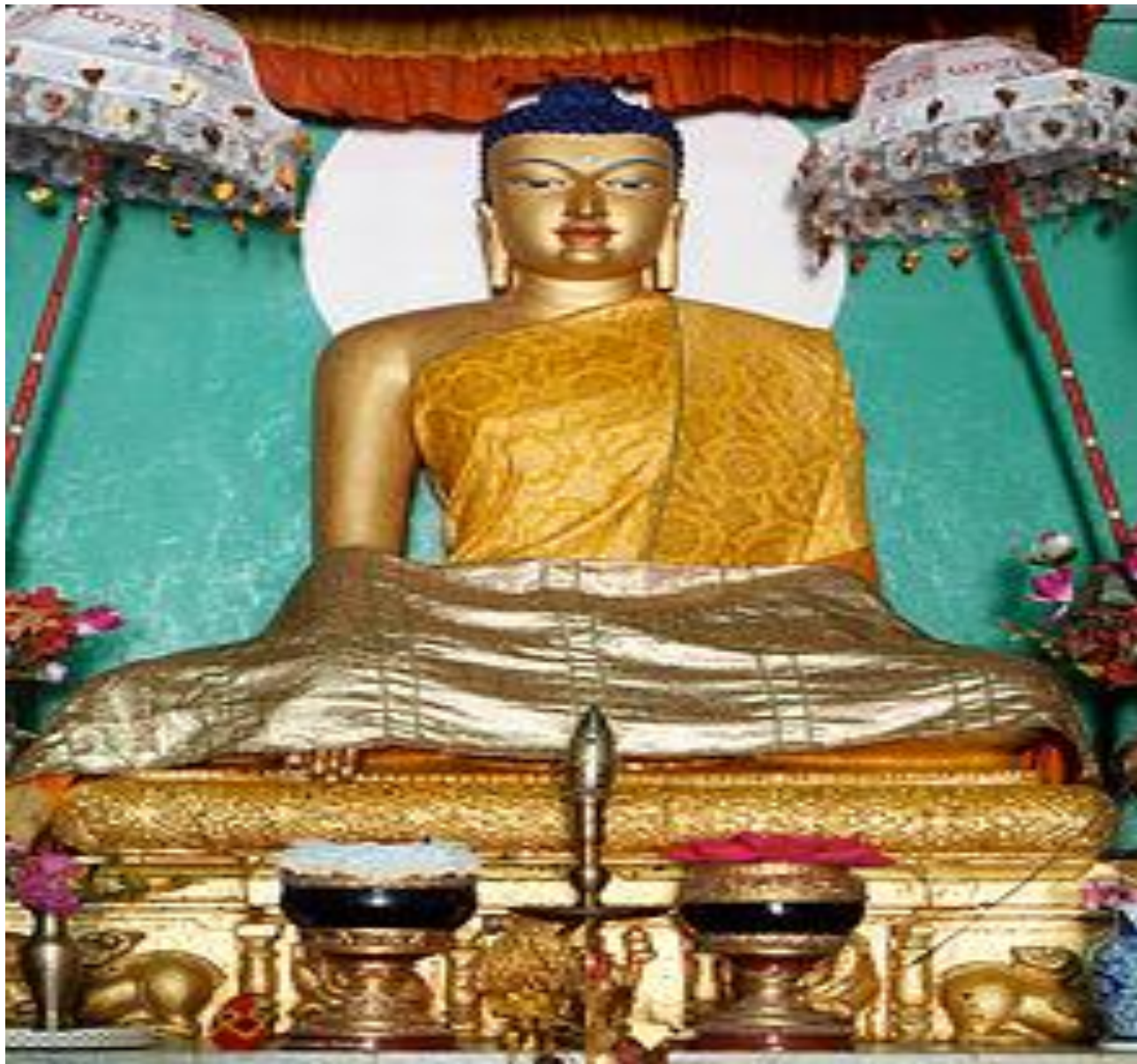
Үндістан , Бодх-Гаяда Сиддхартха Гаутаманың мүсіні