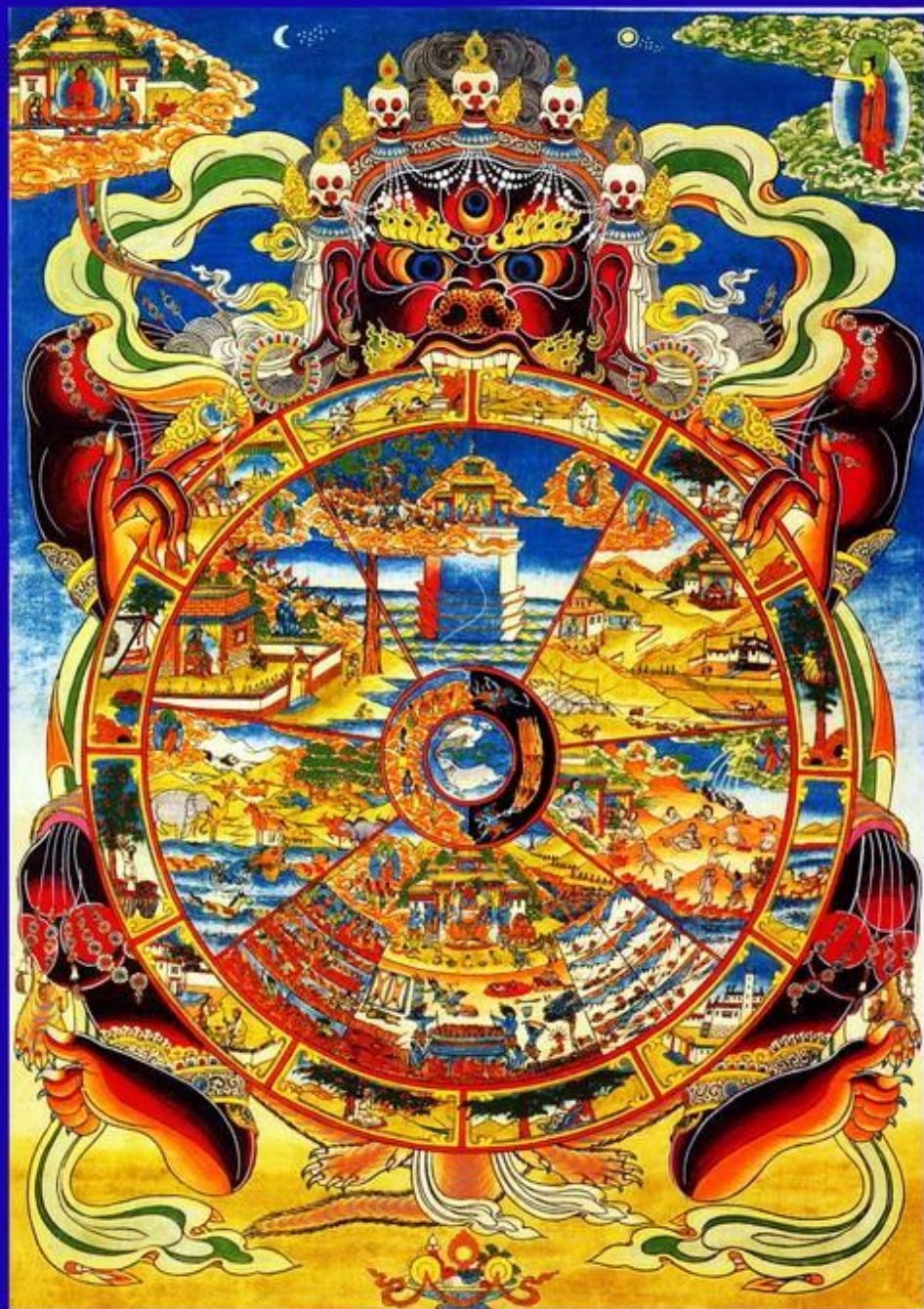
Wheel of Life