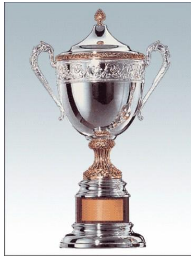
► Людмила ВАЩЕНКО.