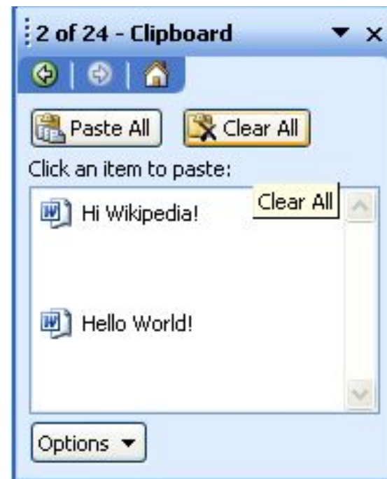
Буфер обмена Microsoft Word 2003

Хотя эти комбинации и являются наиболее распространёнными, некоторые приложения могут использовать какие-либо другие комбинации клавиш. Например в X Window System, кроме вышеописанного буфера обмена, доступен буфер «выделения», для копирования в который достаточно лишь выделить нужную часть текста, а для вставки достаточно нажать среднюю кнопку мыши или же одновременно левую и правую кнопки (имитация средней кнопки).