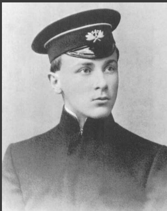
Михаил Булгаков во время учёбы в гимназии