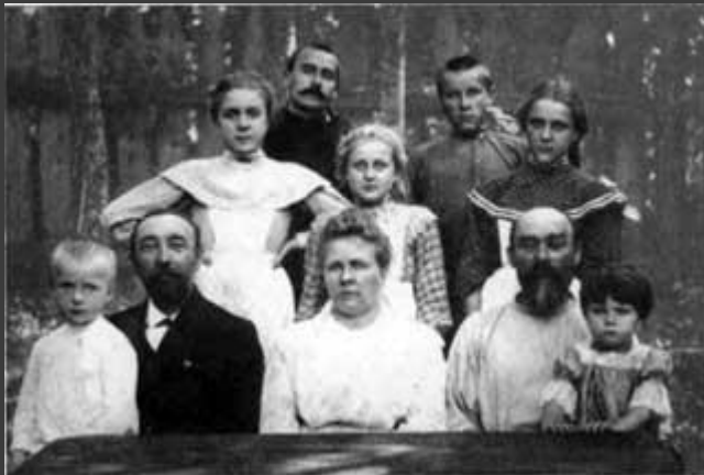
Семья Булгаковых на даче в Буче. Слева направо сидят: Ваня, Д. И. Богдашевский, Варвара Михайловна, Афанасий Иванович с Лелей; стоят: Вера, Варя, Надя; в верхнем ряду: Борис Богданов и Михаил Булгаков Семья Булгаковых