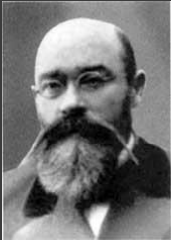
Афанасий Иванович Булгаков. «Основной чертой мировоззрения Афанасия Ивановича была его церковность»