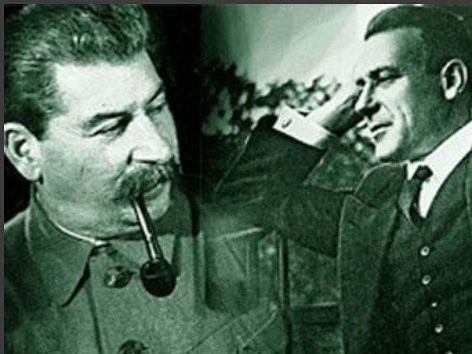
Сталин и Булгаков

«Телеграфируйте обманом приезд Таси. Миша стреляется»