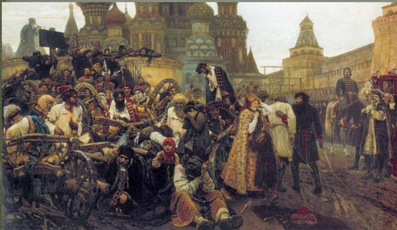
стрелецкое восстание в Москве (1682)

Стрелецкий бунт 1682 года (историческое название Хованщина ) — бунт московских стрельцов в начале правления Петра Алексеевича, в результате которого его соправителем стал старший брат Иван, а фактической правительницей при них стала сестра Софья Алексеевна.