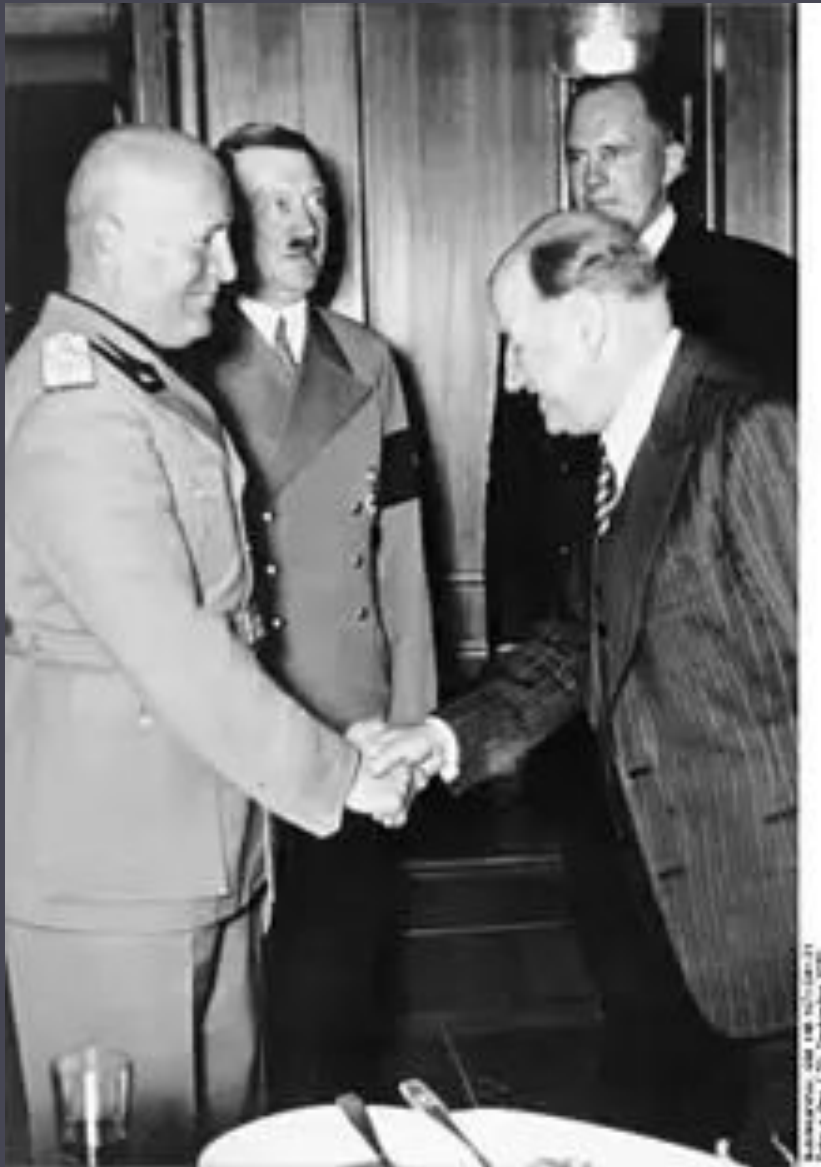
Даладье, Гітлер та Муссоліні