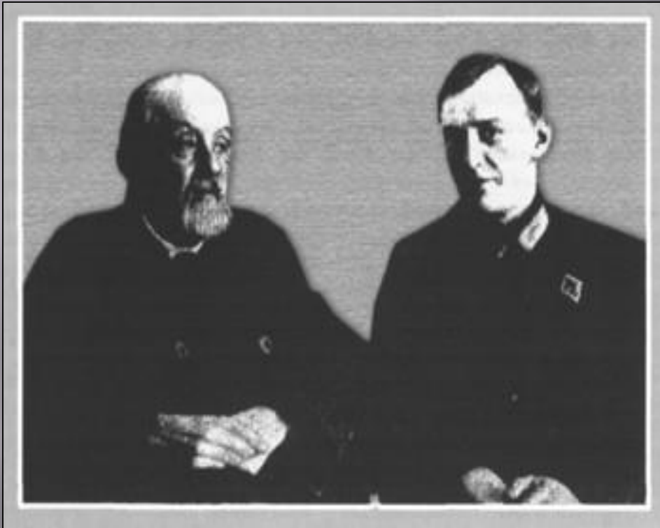
Циолковский К.Э. и Тихонравов М.К.

Идея соединить космическое и земное направления человеческой деятельности принадлежит основателю теоретической космонавтики К.Э. Циолковскому. Когда ученый говорил: "Планета есть колыбель разума, но нельзя вечно жить в колыбели", он не выдвигал альтернативы - либо Земля, либо космос. Циолковский никогда не считал выход в космос следствием какой-то безысходности жизни на Земле. Напротив, он говорил о рациональном преобразовании природы нашей планеты силой разума. Люди, утверждал ученый, "изменяют поверхность Земли, ее океаны, атмосферу, растения и самих себя. Будут управлять климатом и будут распоряжаться в пределах Солнечной системы, как на самой Земле, которая еще неопределенно долгое время будет оставаться жилищем человечества".