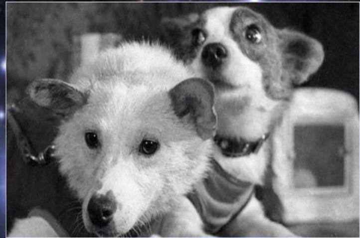
Белка и Стрелка первые космонавты

Советские собаки-космонавты, первые животные, совершившие орбитальный космический полёт и вернувшиеся на Землю невредимыми. Полёт проходил на корабле «Спутник-5». Старт состоялся 19 августа 1960 года, полёт продолжался более 25 часов, за это время корабль совершил 17 полных витков вокруг Земли.