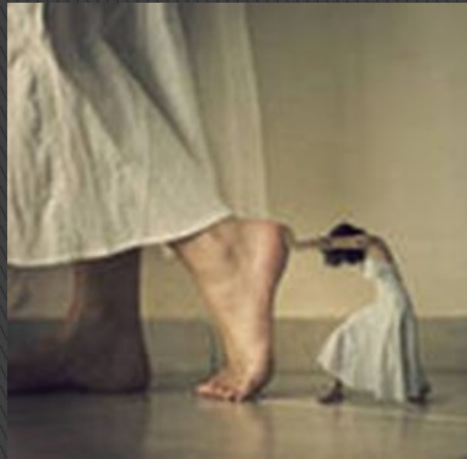
Мотивация в процессе