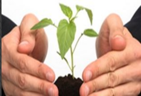
Помощь на старте