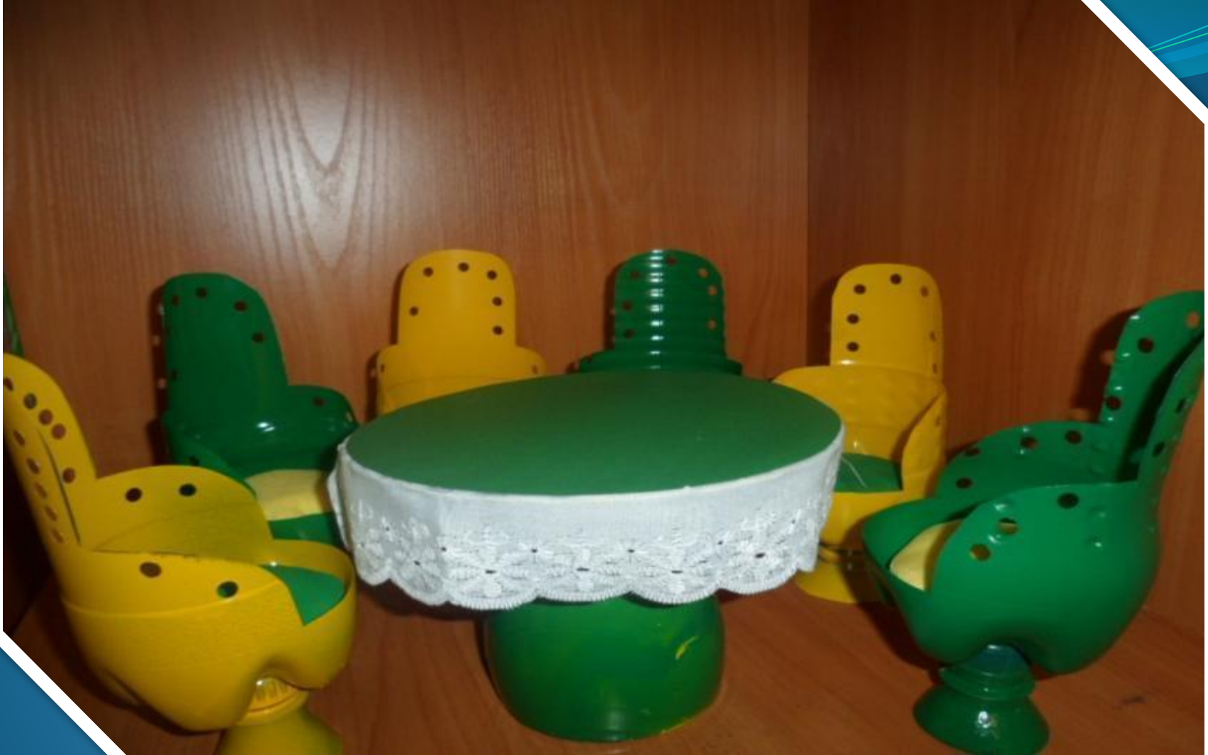
Мебель для столовой в кукольный домик