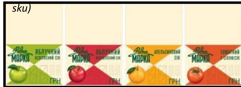
Цінники (окремо по кожному sku)