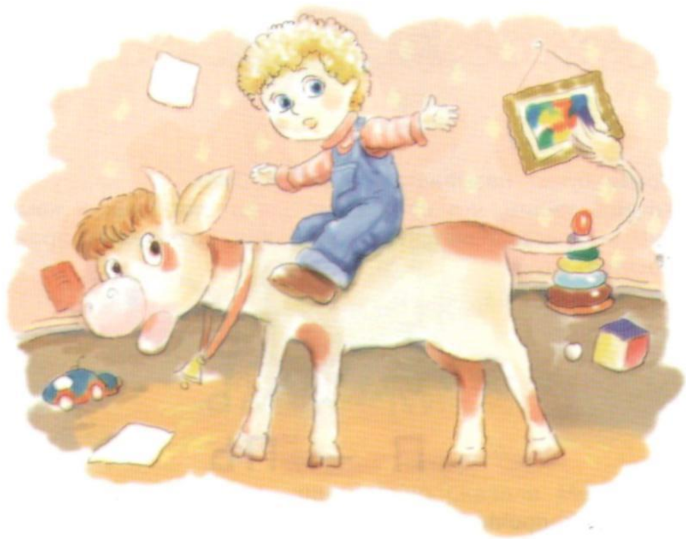
The illustration shows a young boy riding a donkey in a room filled with toys.