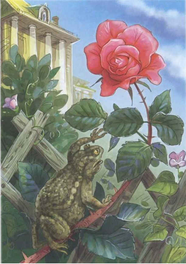
Сказка о жабе и розе