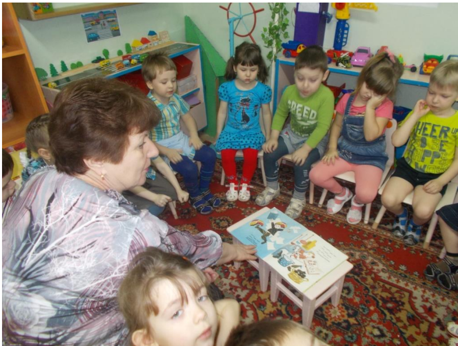
Рассматривание иллюстраций к книге