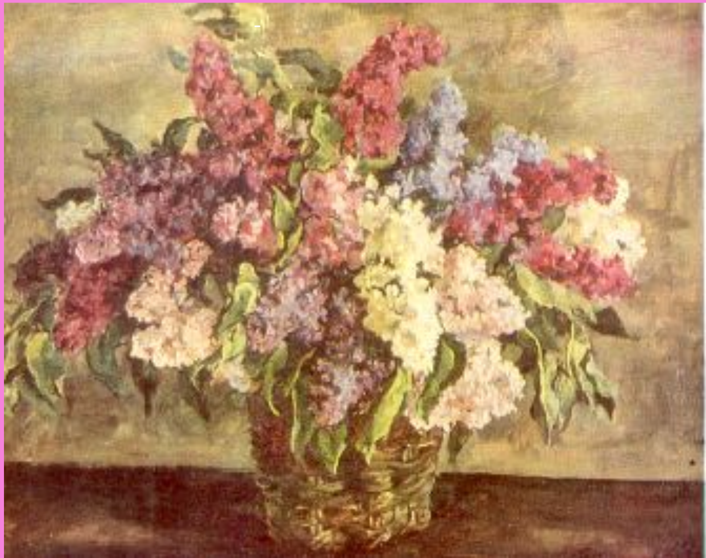
«Сирень в корзине» П. П. Кончаловский