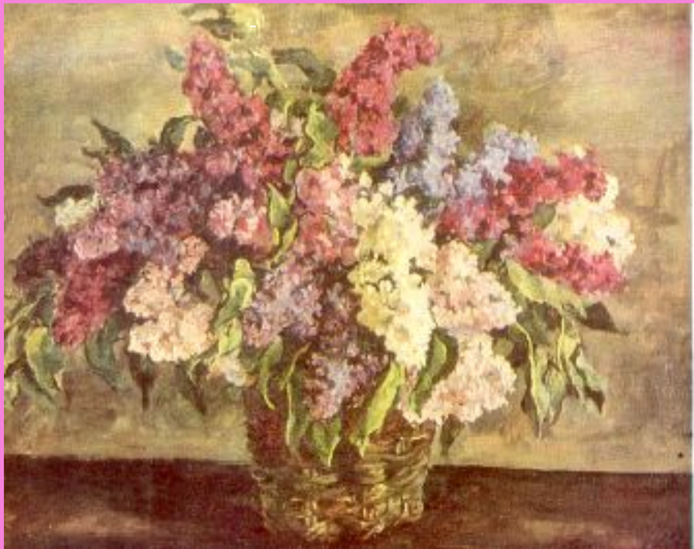
«Сирень в корзине» П. П. Кончаловский