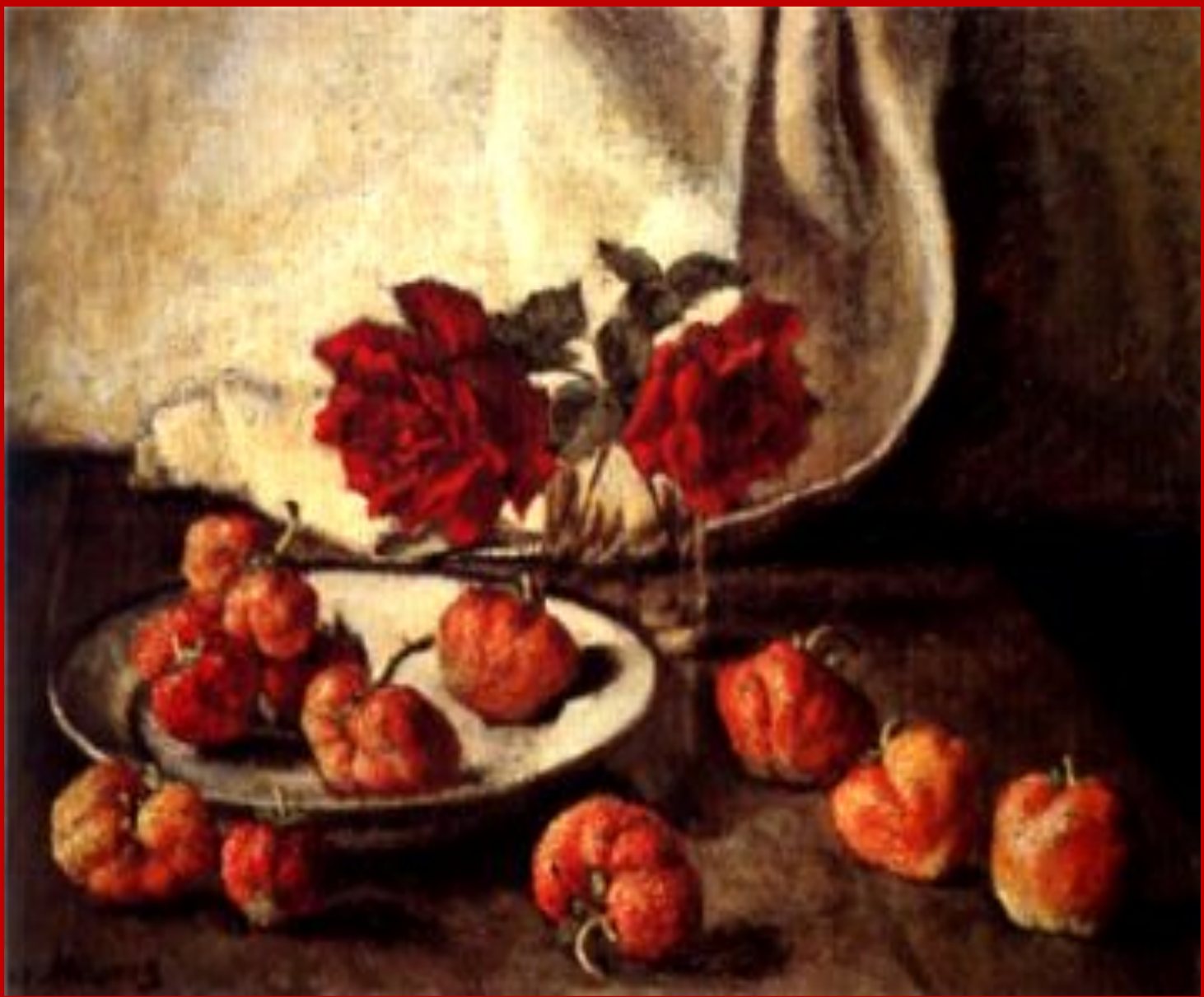
«Две темные розы и тарелка с клубникой»