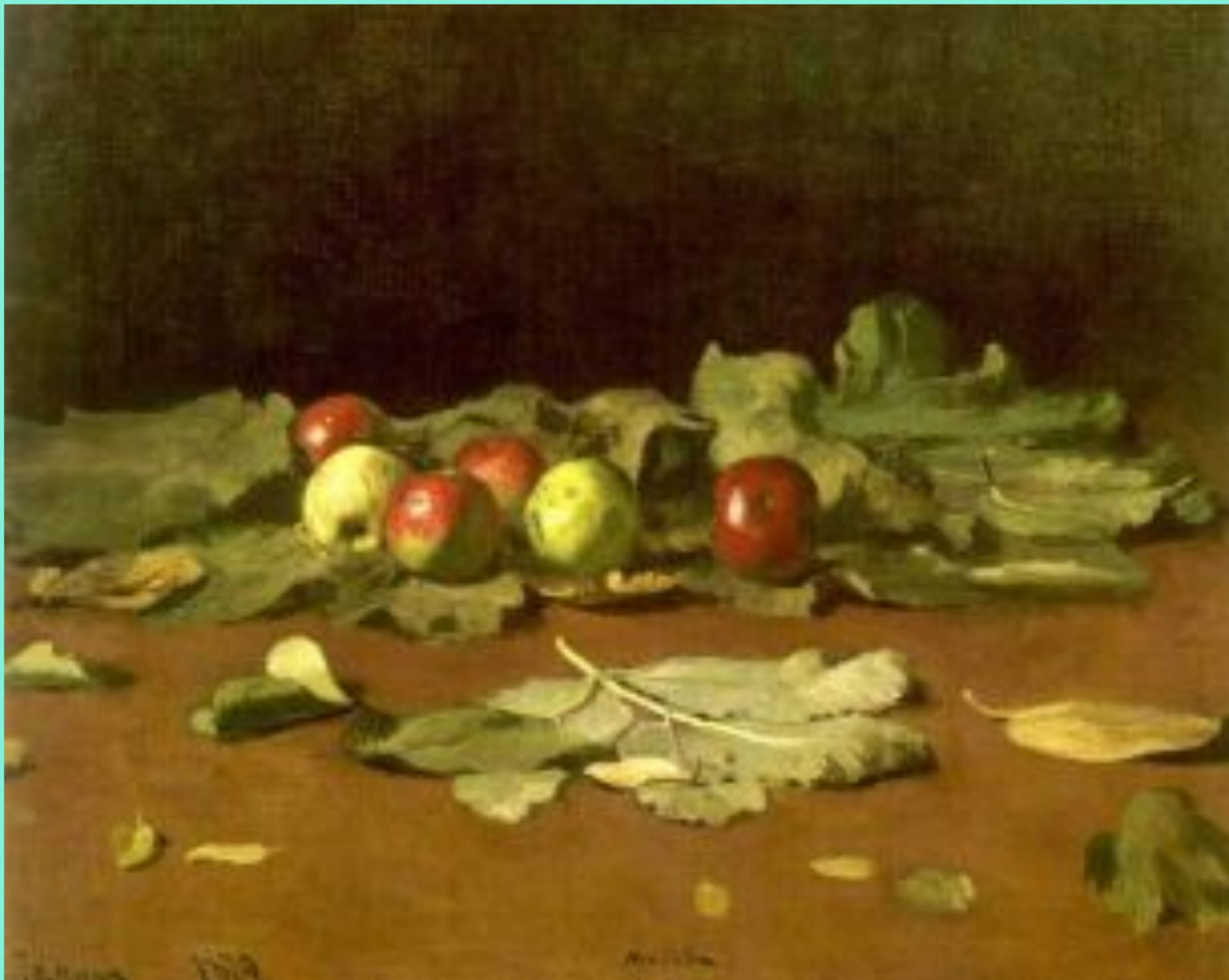
«Яблоки и листья» И.Е.Репин

Яблоки рассыпаны на темно-коричневом столе, лежат на листочках. Яблоки нарядные, красно-зеленые, с блестящими бочками. В центре картины — свежее ярко-зеленое яблоко; слева от него — два красных яблока с чуть зелеными боками: одно впереди, другое как бы спряталось; чуть подальше — еще одно, красное, выглядывает из-за яблока с желтым боком. В стороне, справа, отдельно лежит еще одно красное яблоко. Ближе к нам, на переднем плане, лежат несколько маленьких светло-коричневых листочков, а в центре — веточка с бледно-зелеными листиками. Наверное, художник писал эту картину ближе к вечеру: солнечный луч упал слева сверху и осветил яблоки и листья, особенно ярко высветив маленький листочек, и листочек стал светлым, желто-коричневым. Посмотрите: если его прикрыть, то в картине будет чего-то не хватать. Почему? Все яблоки лежат слева, а справа, если бы не было листьев, было бы пусто и как-то некрасиво. Свет играет на листьях и яблоках. На красновато-коричневом темном фоне освещенные яблоки сверкают, будто драгоценные камни.