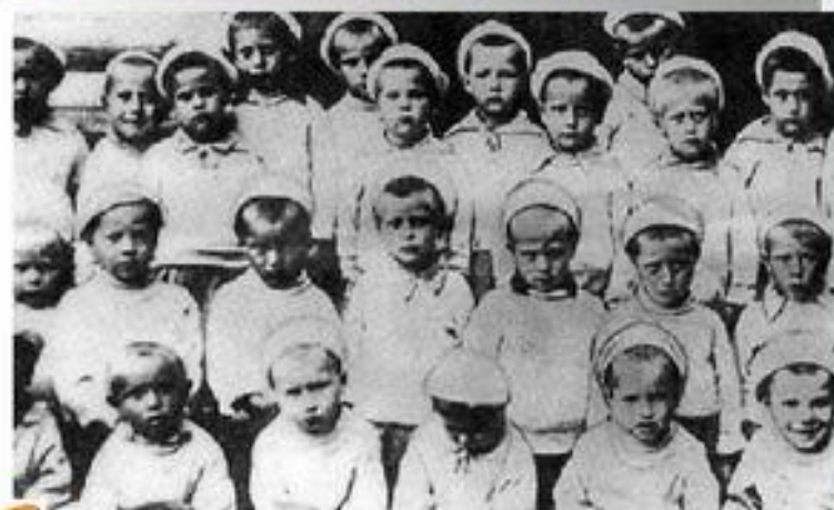
Дети из блокадного Ленинграда