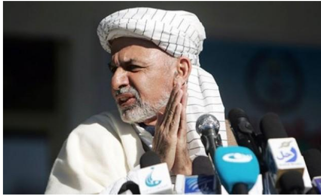
Ашраф Гани Ахмадзай