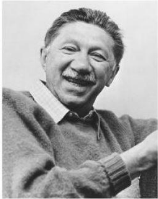
Абрахам Харольд Маслоу (Маслов)