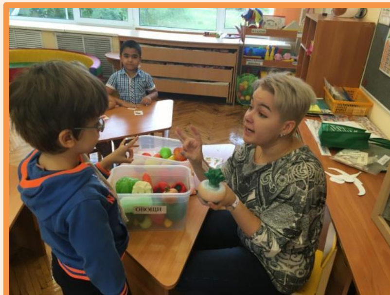
Игровое упражнение «Найди и