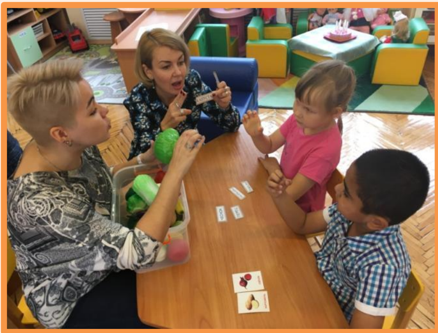
Игра «Четвёртый лишний» на слухо-зрительной устно- дактильной основе.