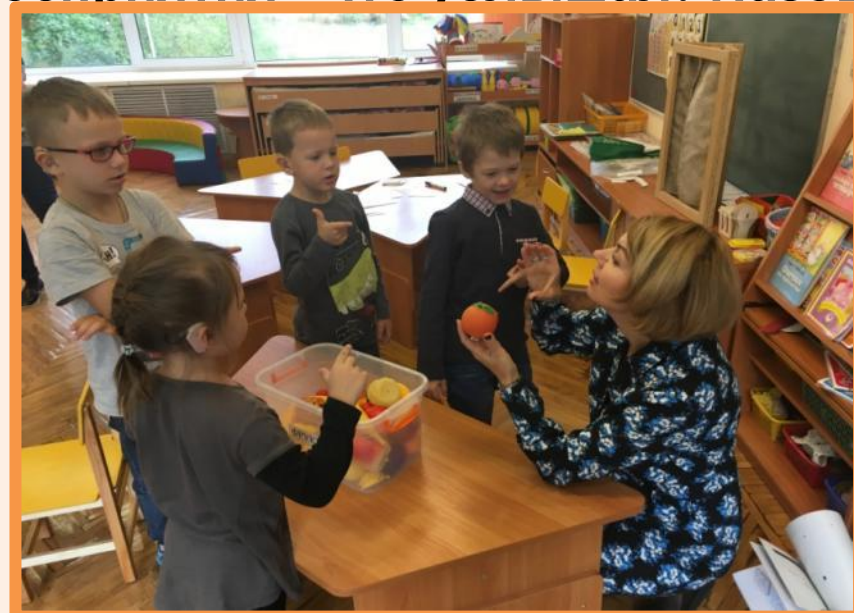
Игра «Найди на ощупь»