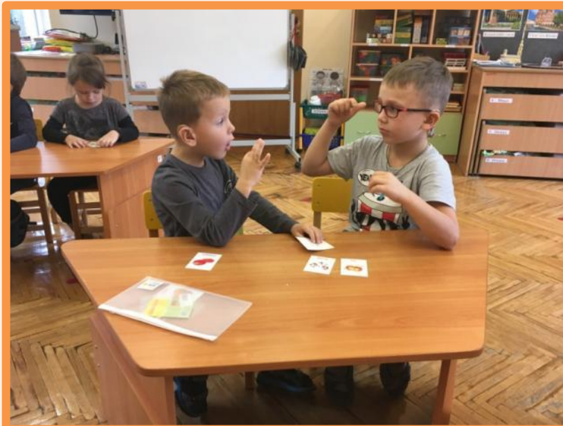
Повторение названия овощей. «Маленький учитель»