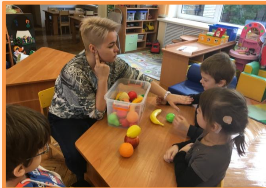
Игра на развитие слухового восприятия «Что услышал? Назови