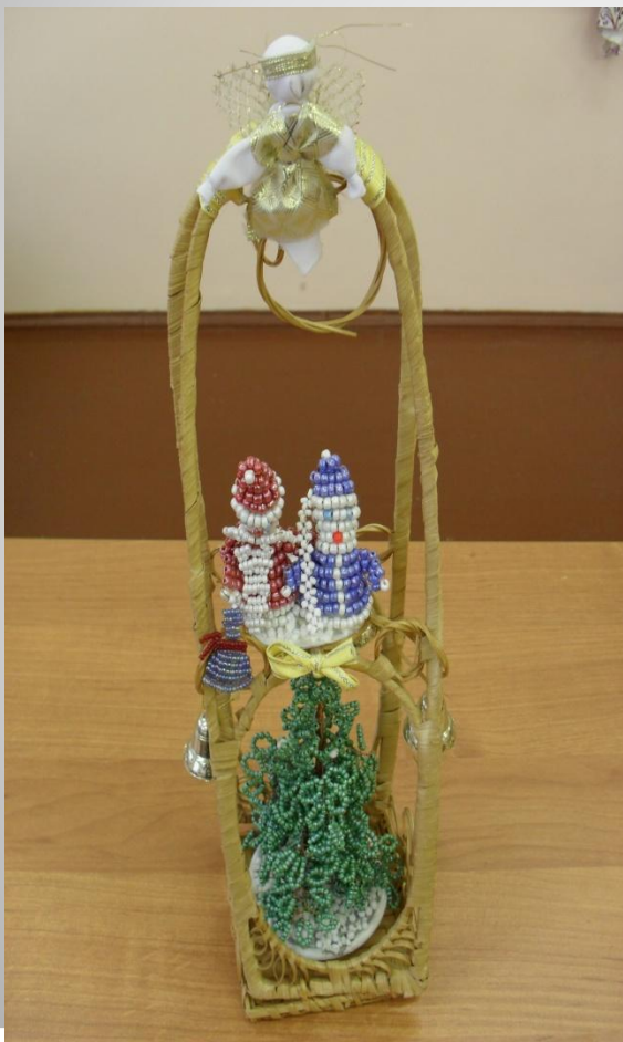
Композиция «Дед мороз и снегурочка»