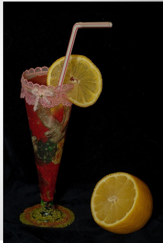
Декоративный фужер в технике декупаж