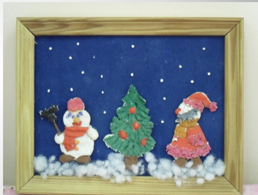
Панно «Новогодняя ночь»