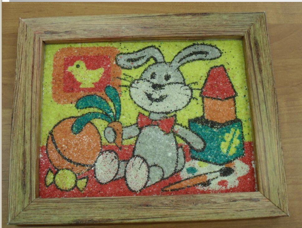
Панно «Веселый зайчик»