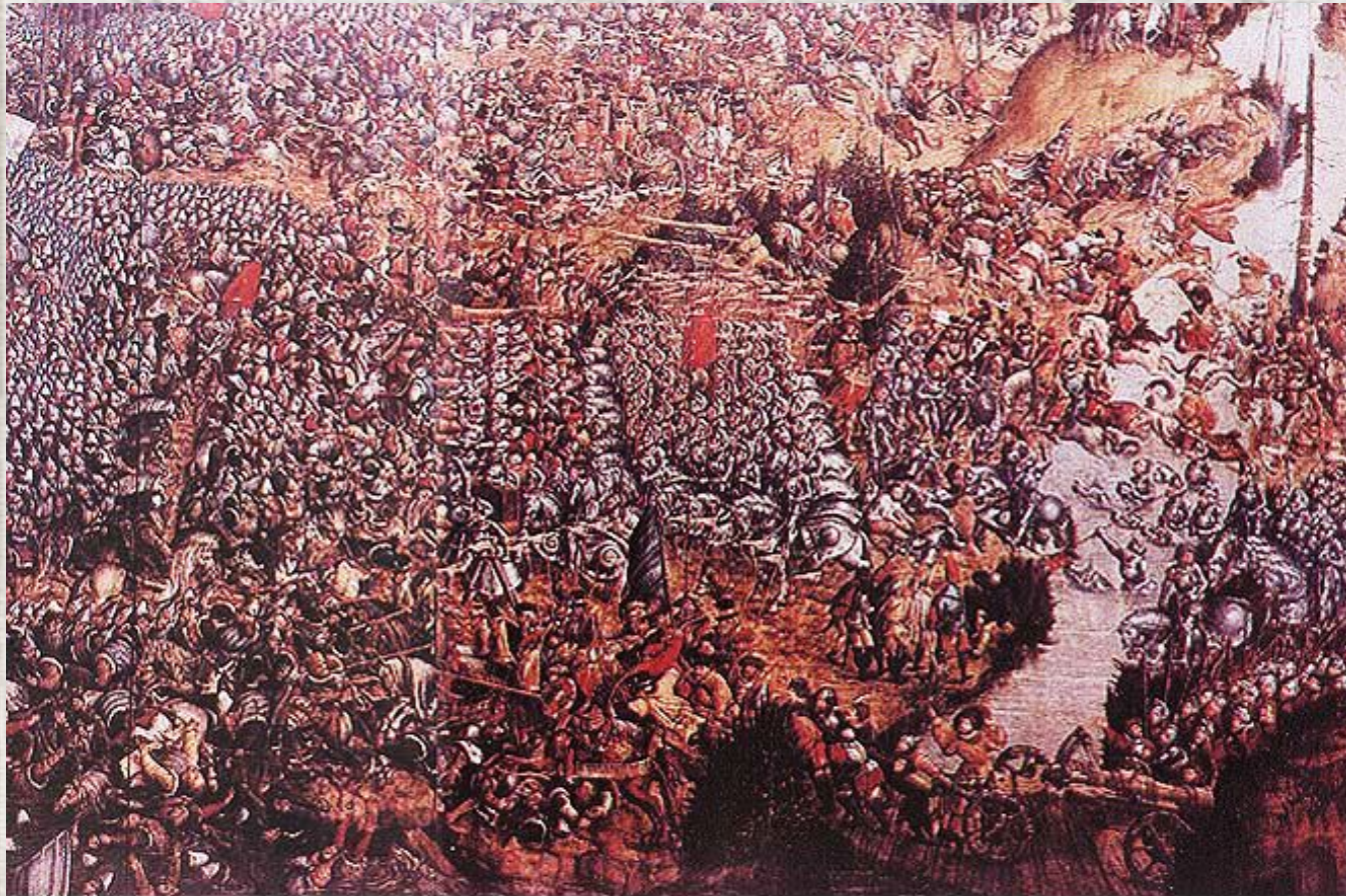
Невядомы мастак. Бітва пад Оршай. Нацыянальны музей Польшчы.