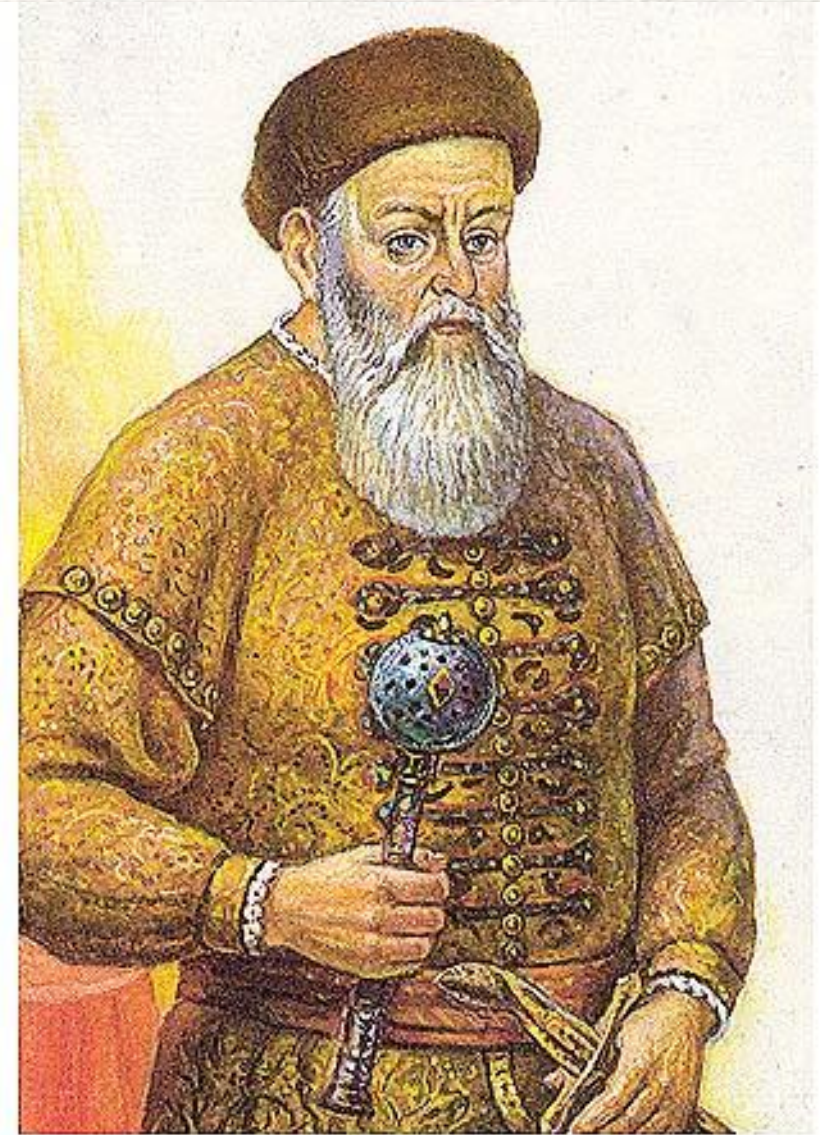
Найвышэйшы гетман ВКЛ Канстанцін Астрожскі