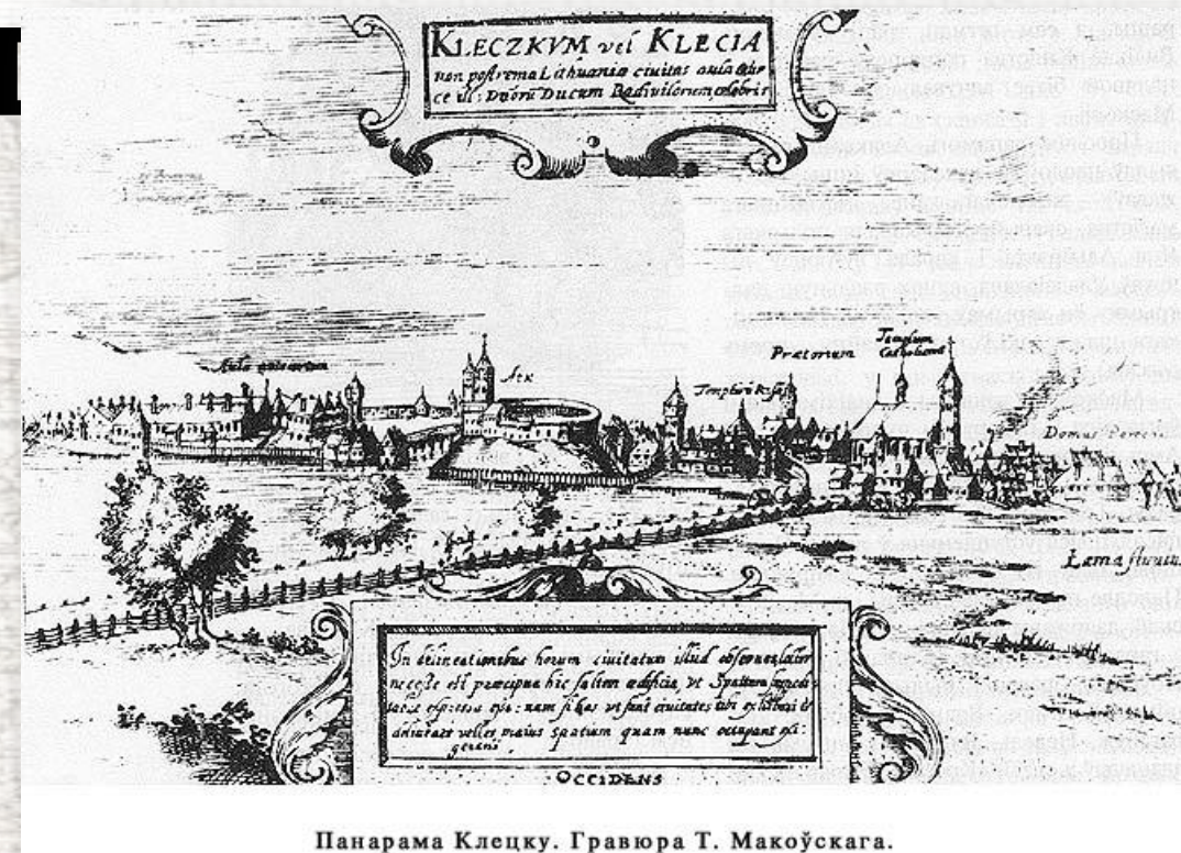
Панарама Клецку. Гравюра Т. Макоўскага.