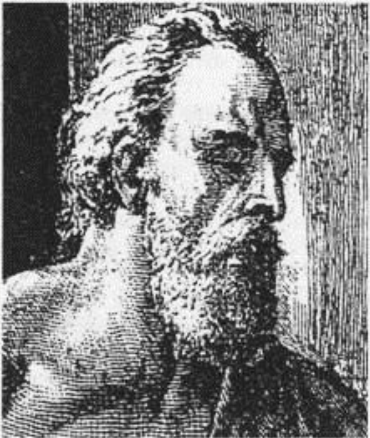
Михаил Глинский. Худ. К. Милер, 1875 г.