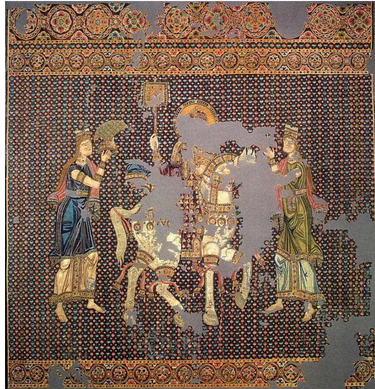
Килим. Візантійський шовковий килим , 11 ст., Бамберг , Німеччина