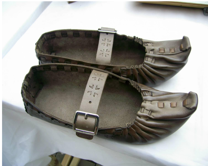
Гуцульські чоловічі постоли .