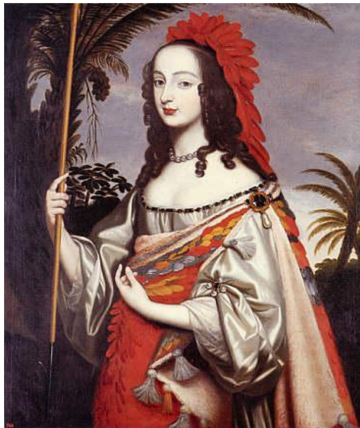
Художниця Луїза Голландіна. Софія Пфальцьська в маскарадному вбранні американської індіанки бл. 1644