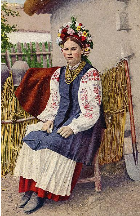
Українка-дівчина в вишиванці, листівка, 1916 р.