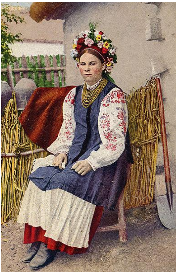
Українка-дівчина в вишиванці, листівка, 1916 р.