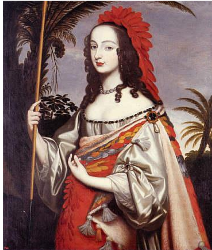
Художниця Луїза Голландіна. Софія Пфальцьська в маскарадному вбранні американської індіанки бл. 1644