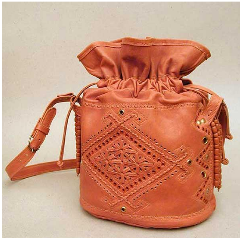
Робота Василя Кіщука.