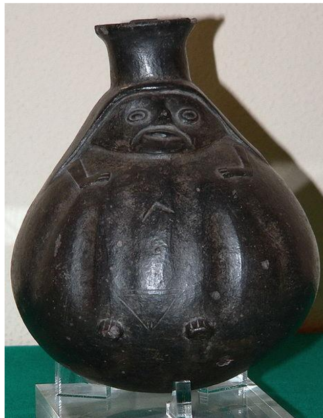
Чорна кераміка інків