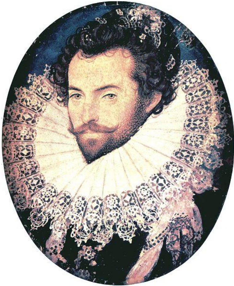
Мережево. Худ. Ніколас Гілард. Волтер Релі