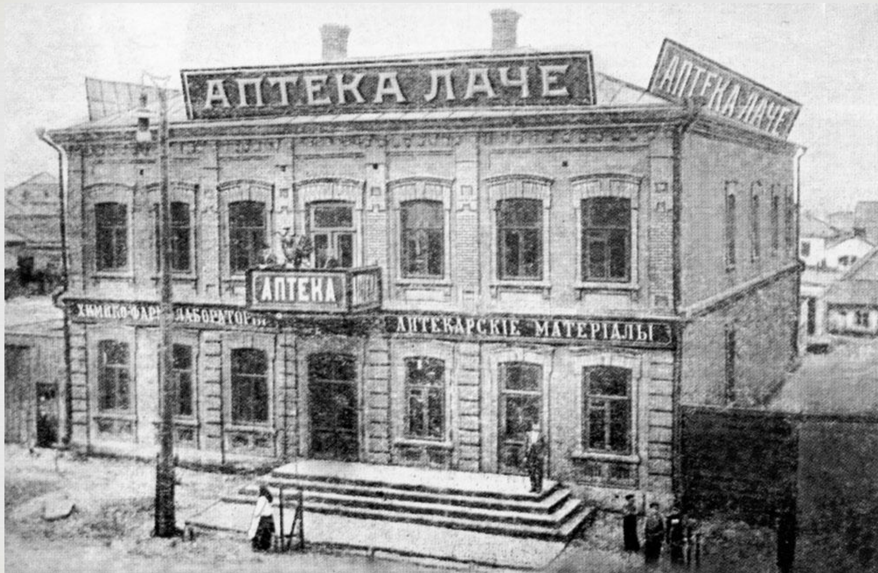
Типичная аптека 19 века( государственная царская)