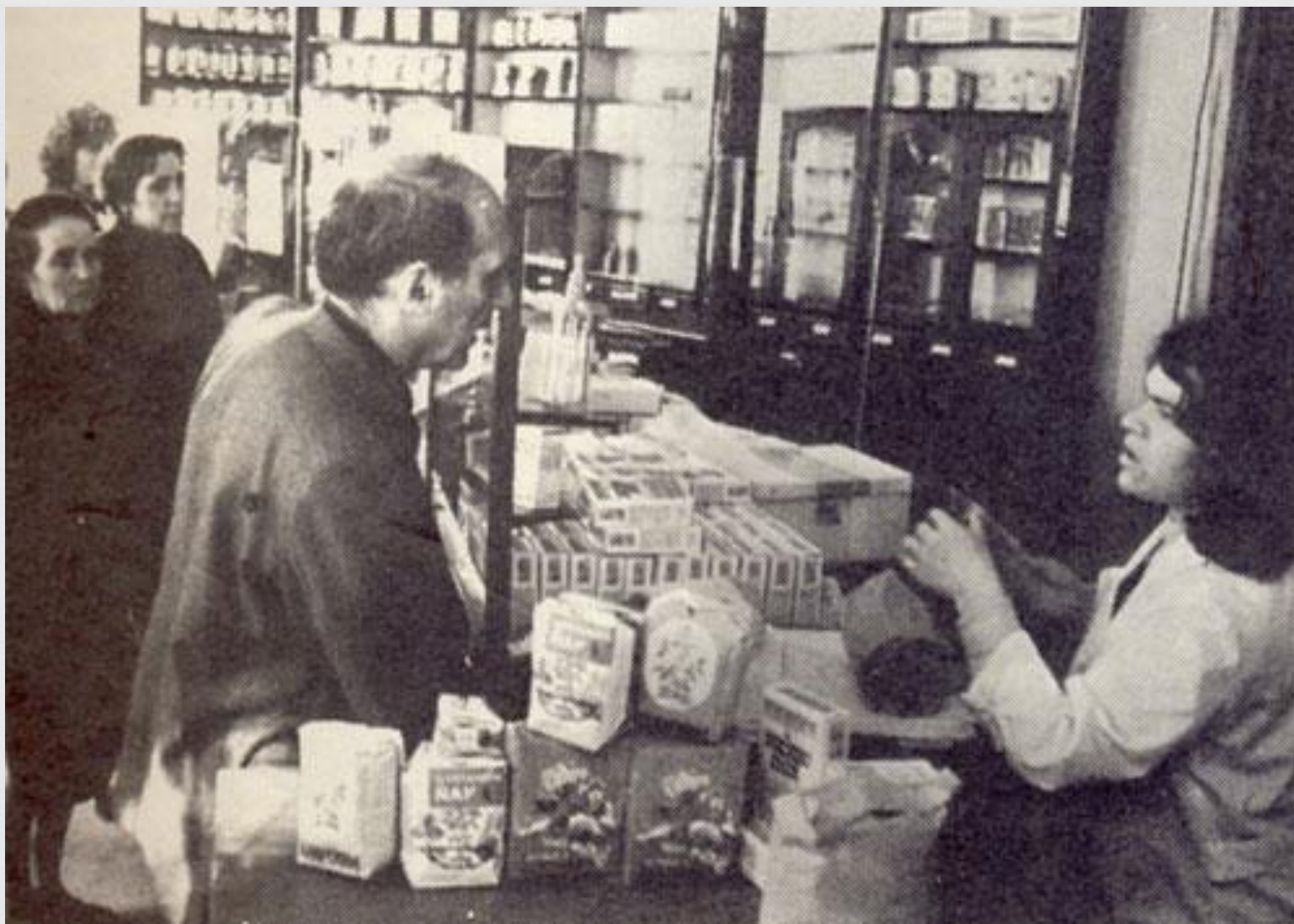
Типичная хозрасчетная аптека 20 века