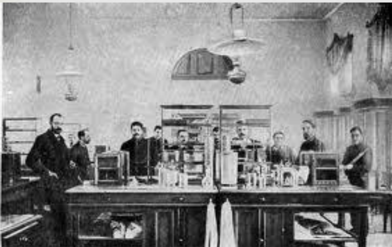
Контрольно-аналитическая лаборатория 20 век