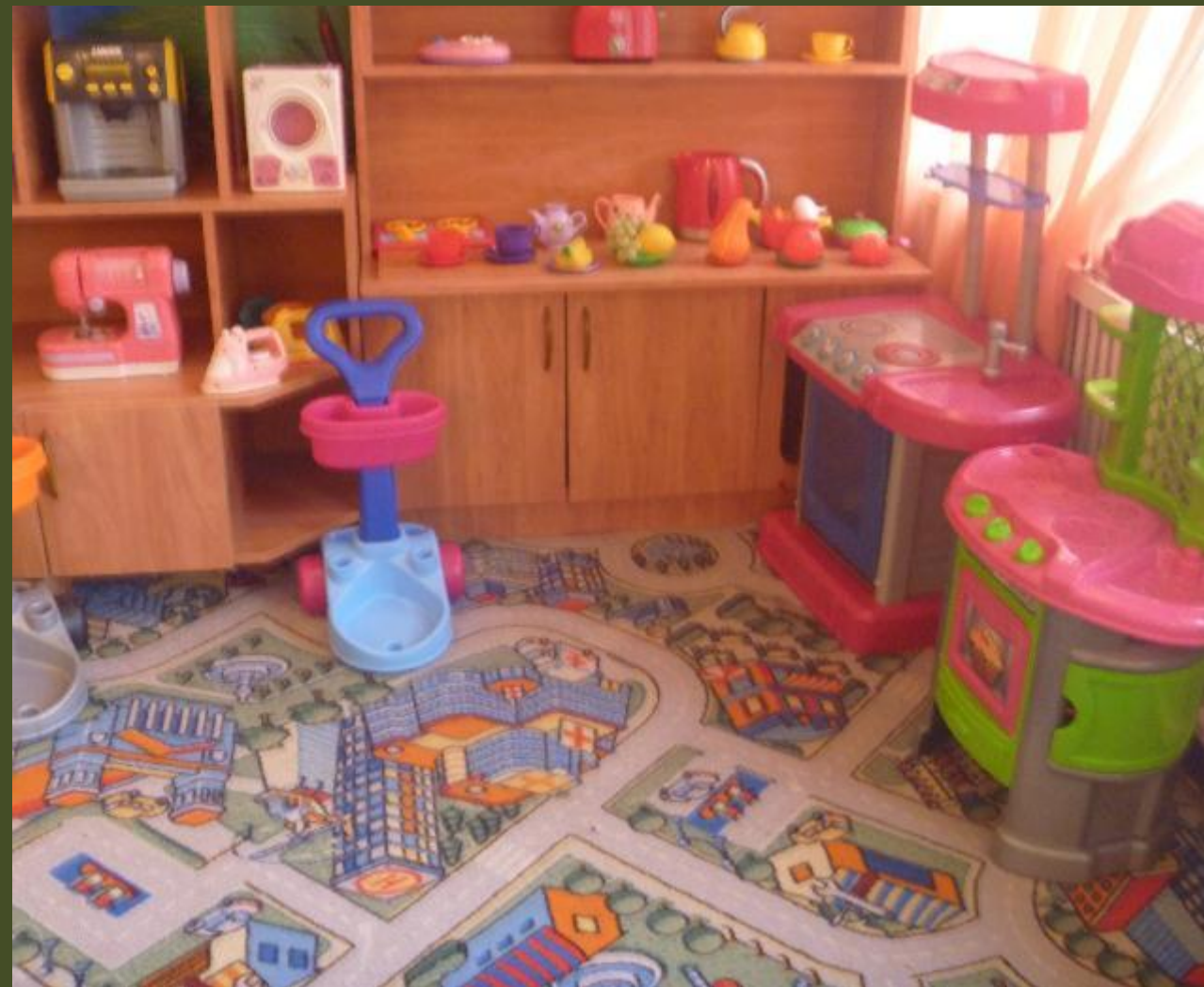
2.2. Активный сектор (центр ...)