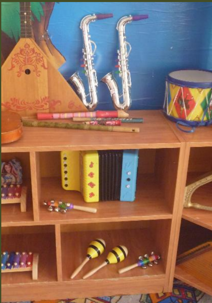
2.2.2. Активный сектор (модуль ...)