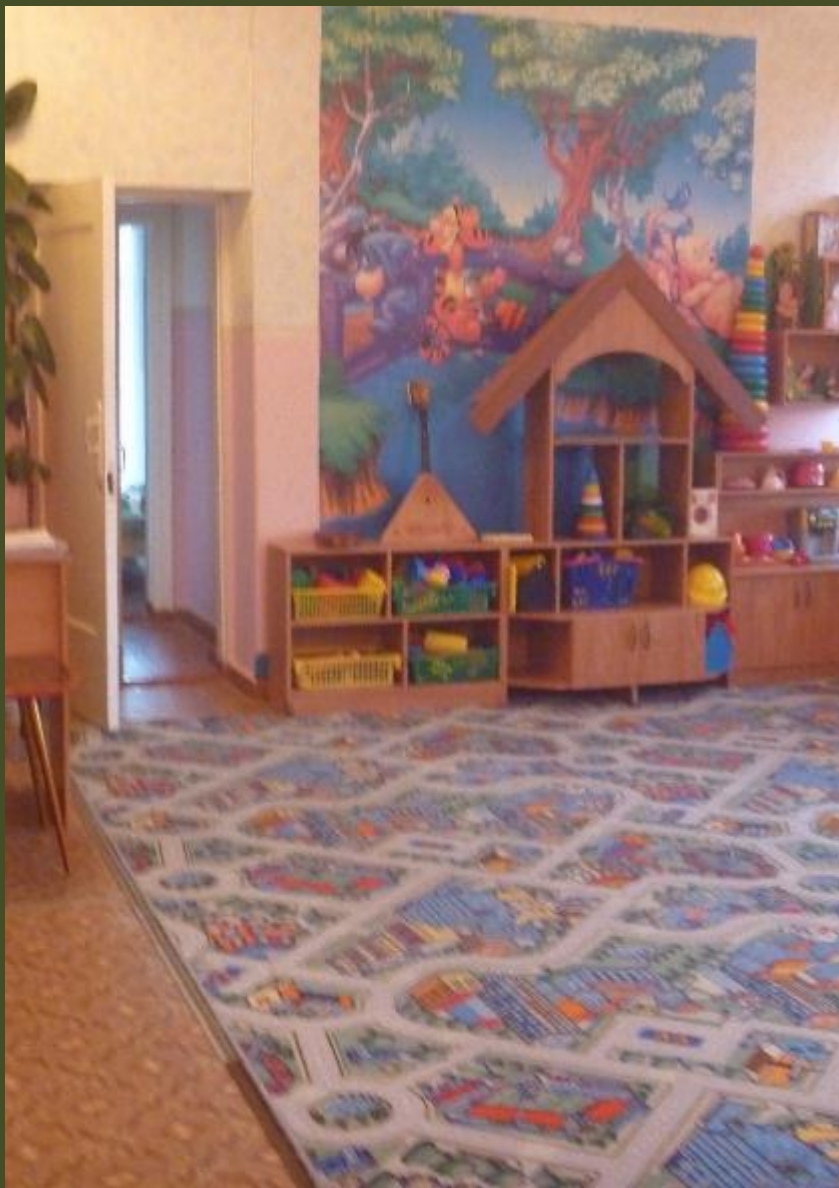
2.2.4. Активный сектор (модуль ...)