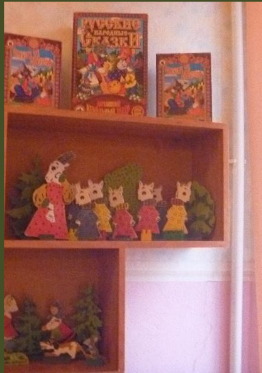
2.2.5. Активный сектор (модуль ...)