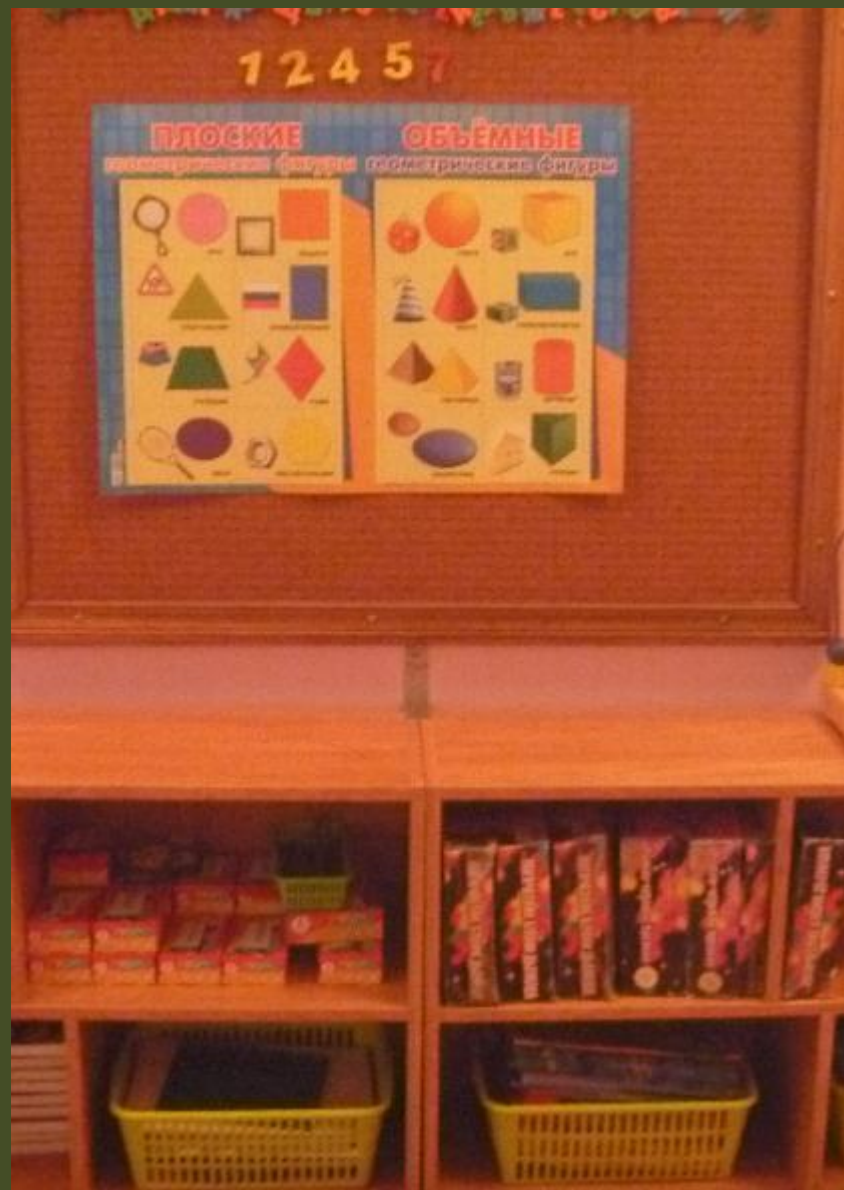
1.1.1. Рабочий сектор (модуль...)