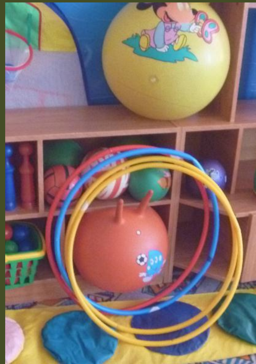
2.2.3. Активный сектор (модуль ....)