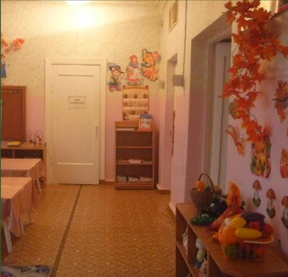
Вид из центра группы на вход в помещение