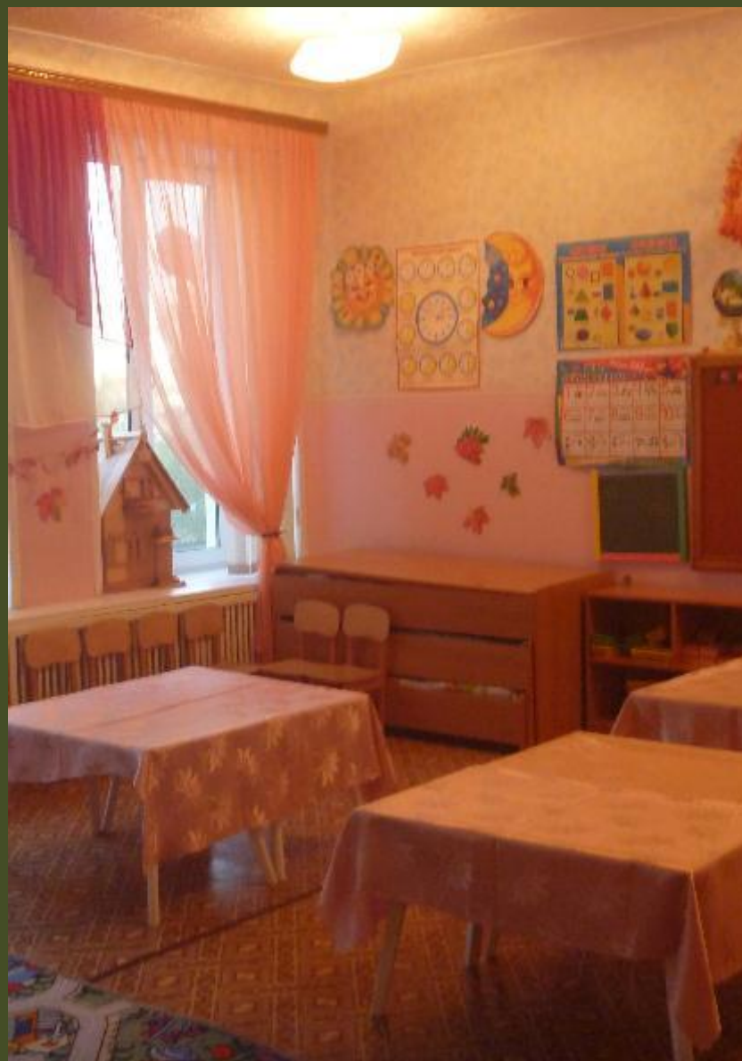
1.1.2. Рабочий сектор (центр...)