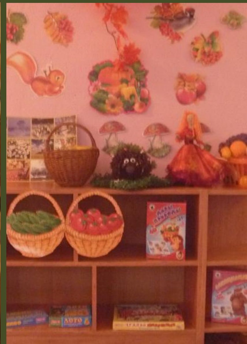
1.1.3. Рабочий сектор (модуль...)