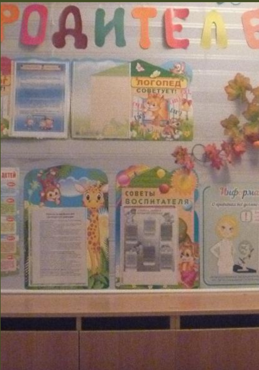
4.1. Среда для диалога с родителями (информационный центр)