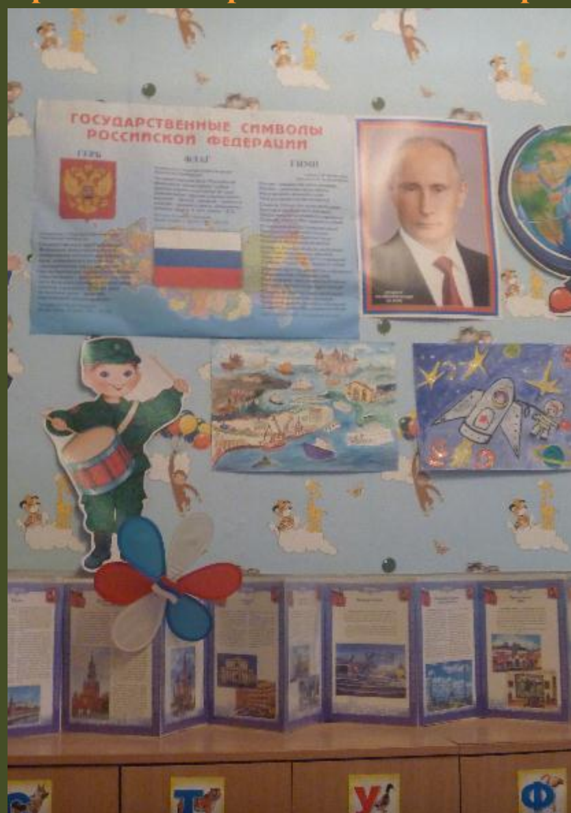
4.2. Среда для диалога с родителями (консультационный центр)