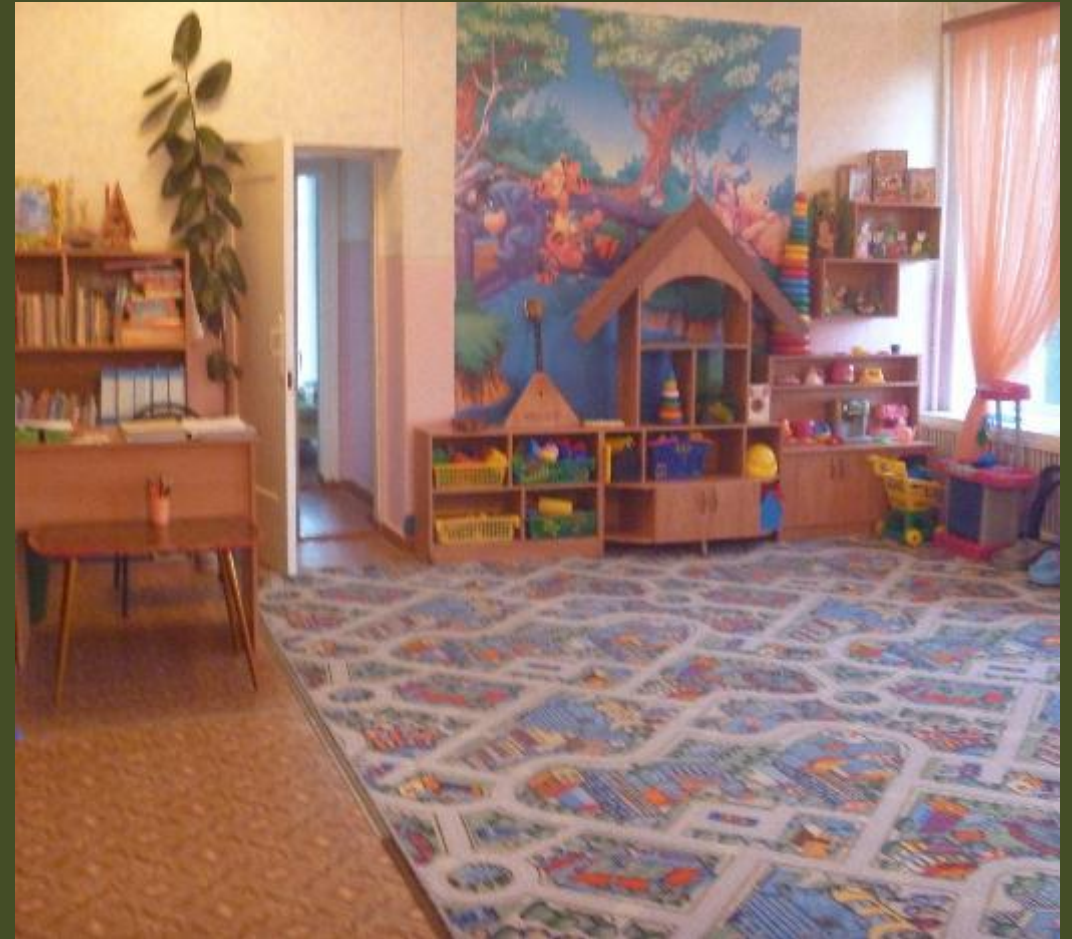
Вид из центра группы в противоположном входу направлении