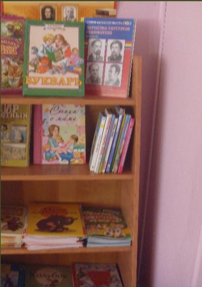
2.4. Спокойный сектор (центр ...)