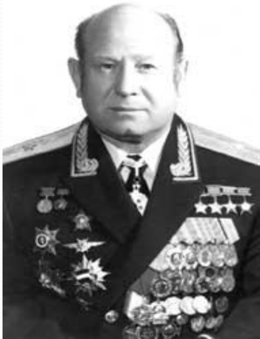
Леонов Алексей Архипович Дважды Герой Советского Союза

18-19 марта 1965 года совершил космический полёт в качестве второго пилота космического корабля «Восход-2» (командир – полковник П.И.Беляев) продолжительностью 1 сутки 2 часа. В ходе полёта 18 марта 1965 года выполнил первый в мире выход в открытый космос продолжительностью 23 минуты 41 секунда. Во время выхода проявил исключительное мужество, особенно в нештатной ситуации, когда разбухший космический скафандр препятствовал возвращению космонавта в космический корабль.